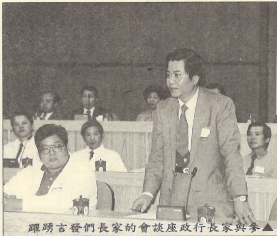
躍踴言發們長家的會談座政行長家與參

【本刊訊】本校為加強學生家長對學校的認識，將近年來各項軟、硬體建設成果向家長充份說明，並聽取學生家長的建議，本校於十二月十日舉辦「八十一學年度家長、行政座談會」，邀請學生家長代表六十人與會。