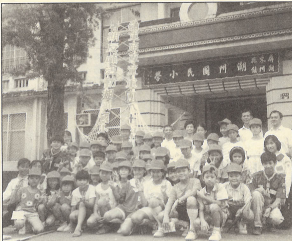
本校服務隊於暑假(八十一)年八月十八日至廿四日(出隊)地點在彰化田尾鄉、田國中、國小、陸豐國小、仁豐國小、與田尾鄉各地方民家打成一片，建立了良好的友誼。

【本報訊】由本校服務隊於暑假(八十一)年八月十八日至廿四日(出隊)地點在彰化田尾鄉、田國中、國小、陸豐國小、仁豐國小、與田尾鄉各地方民家打成一片，建立了良好的友誼。