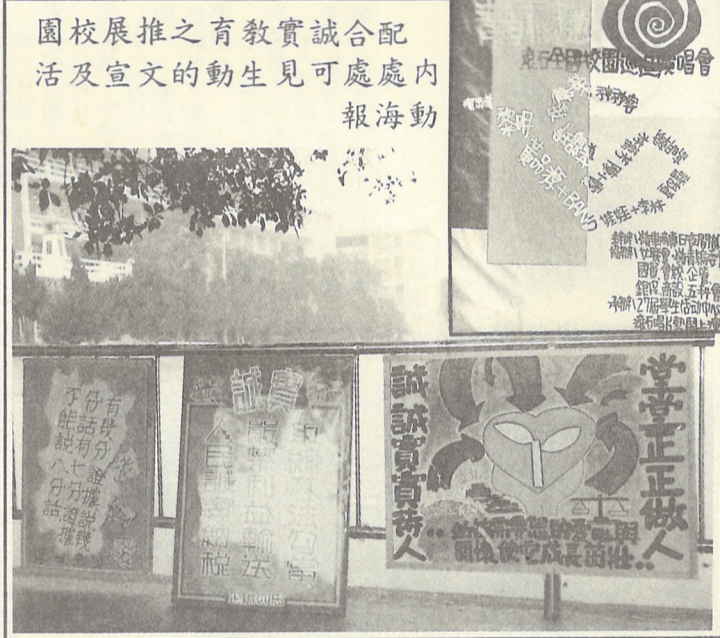
園校展推之育教實誠合配 活及宣文的動生見可處處內 報海動

【本刊訊】為配合教育部加強誠實教育專案所實施的「反賄選教育總動員計劃」，本校力倡培養誠實風氣，匡正選風，淨化社會，特舉辦一系列活動。 除了依照本校誠實專案推動小組「誠實教育專案」計劃所舉辦之各項文宣、演講座談會及作文、書法、繪畫、暨報等學藝活動外，更發動全校師生舉行「反賄選」簽名運動，一人一信運動及擴大舉行反賄選宣傳晚會，