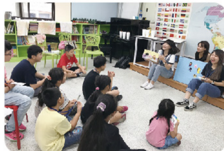
▲應外系學生在苗栗縣武榮國小進行英語繪本教學。

兩天一夜的活動看似短暫，卻連結了兩個城市、不同年齡的孩子。這難得的互動有應外系學生努力的付出與武榮國小孩子們的成長。武榮國小的校長更不斷強調，希望未來還有107、108...連續好多年的歡樂英語夏令營，讓苗栗縣的孩子也能有更多語言的刺激與學習成長的空間。106年的七月，應外系的學生不僅僅讓自己的暑假不留白；更彩繪了偏鄉孩子的童年英語學習！