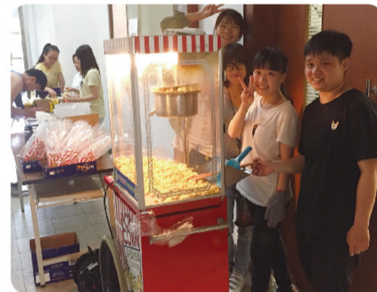
▲ 反毒志工現學現賣擔任爆米花製作小幫手。

為吸引師生主動入場觀賞反毒電影，因此比照電影院的規模，免費提供現場製作的爆米花，十足吸睛。邊吃爆米花邊看「門徒」電影，用輕鬆的心情正視嚴肅的反毒課題！活動圓滿成功！