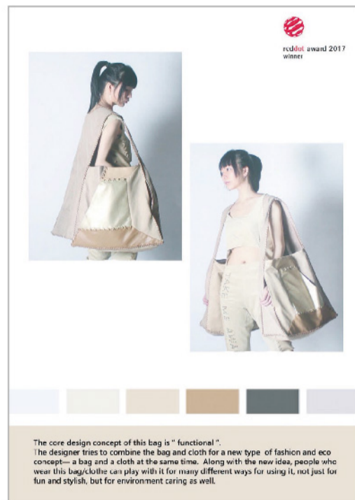
▲ 流行設計系獲獎作品TAKE ME AWAY(袋我走)。