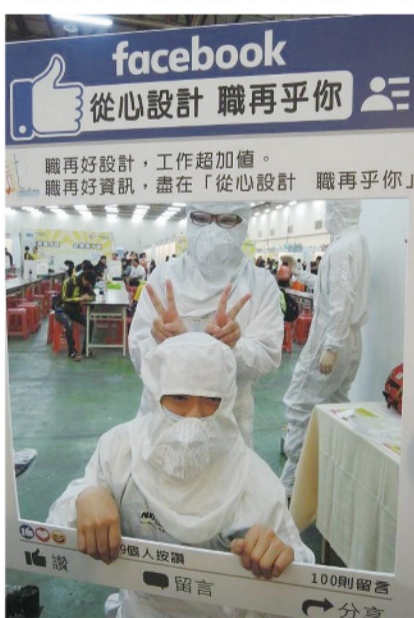
▲ 資源教室學生體驗穿著無塵衣。

此外，當天參加同學皆主動前往義剪彩妝區體驗並學習適合職場的髮型整理與妝容，大家紛紛表示修剪了頭髮又畫了適合上班的彩妝，很有就業的臨場感。在工作體驗區，同學們更是踴躍參與包裝、門市、房務、倉管及清潔等工作模擬體驗，同學們表示透過工作體驗可以更有自信做好工作，也更知道未來就業若從事相關行業，也許哪些部分需要公司協調，或者申請就業資源協助改善環境等，也更清楚知道未來就業有哪些政府資源能夠申請，可以協助自己也協助公司，改善職場環境，創造雙贏的局面。