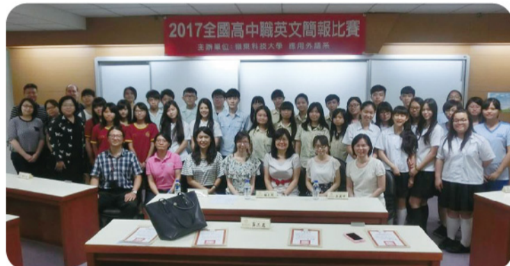
▲ 主辦單位應外系與各校指導老師、參賽同學合影。