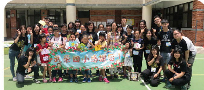
▲兩校師生在操場大合照。