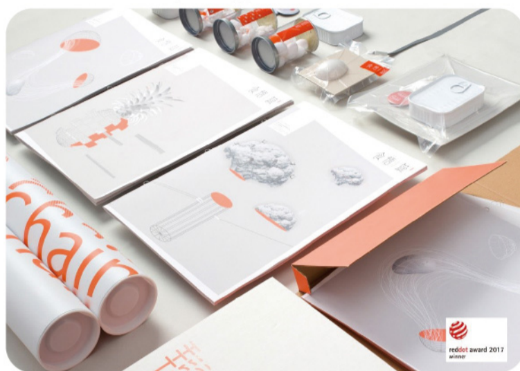
▲ 視覺傳達設計系第十七屆畢業設計主題成果「食悟鏈」。