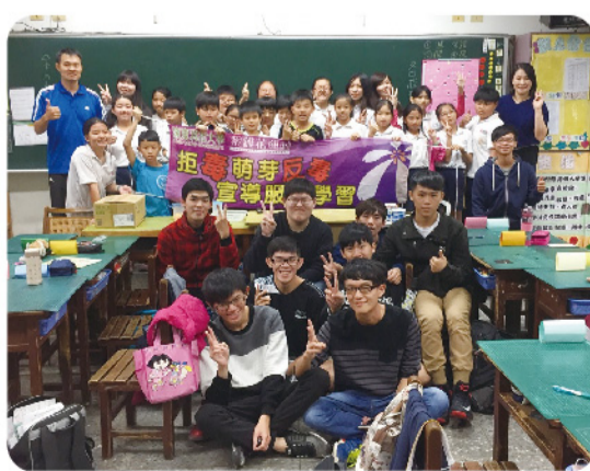
▲ 與光復國小同學快樂合影。

「大手牽小手-拒毒萌芽反毒宣導服務學習」的活動，除了讓國小學童體認到毒品的危害及拒毒技巧外，同時也增強了反毒志工的抗毒知能，並體會到服務學習的真諦與快樂！