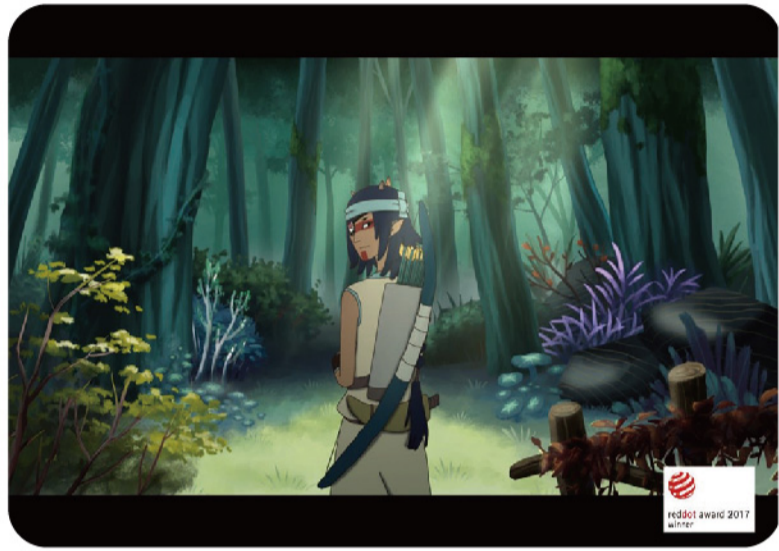
▲ 數位媒體設計系畢業設計作品2D動畫組—「獸 Soul」。

獲獎作品包含本校視覺傳達設計系第十七屆畢業設計主題成果「食悟鏈」，它的概念是透過設計體悟食物與人、文化、環境、社會與美學之間的關係，期望能讓