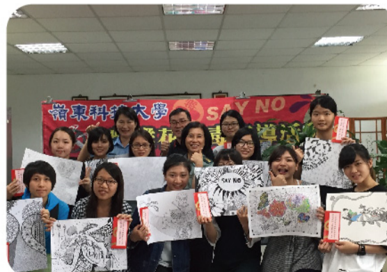
▲ 學務長、軍訓室主任與獲獎同學快樂合影。