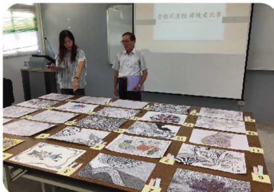
▲ 「紫錐花運動-禪繞畫比賽」複評過程。

此次「紫錐花運動-禪繞畫比賽」活動,規定參賽者將紫錐花反毒意涵及元素融入禪繞畫中,其目的除增強同學對反毒認知外,同時藉由繪畫培養同學正確抒壓及情緒管理的方式,如此將能勇於拒絕毒品誘惑,開創光明人生。