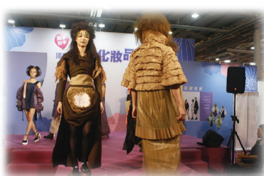
▲ 精選學生作品走秀。

【流行設計系訊】時尚學院流行設計系精選3組畢業作品於5月5日假台中國際美容化妝品展演出，以「戒。時。衣」為主題，為第11屆畢業展活動暖身，透過本校模特兒社專業表現，其完美之動態語言使同學的心血設計滿貫加分！專業的走秀表演吸引了全場民眾的目光，成為當天吸睛度最高的活動。