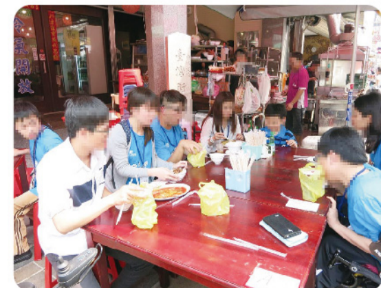
▲ 台南安平老街享用美食。

離開奇美博物館，全體搭車前往下一站-台南安平老街，途中還巧遇盛大的進香團，體驗台灣特有的廟會風情。到達老街後，同學們按照分組團體行動，在安平老街邊遊玩，安平老街保有早期台灣街道的面貌，相對而言也有較多障礙物，因此同學們相互照顧，協助組內行動不便的同學越過重重關卡，一起體驗老街人文及府城美食，同時也更增進彼此之間的友誼。