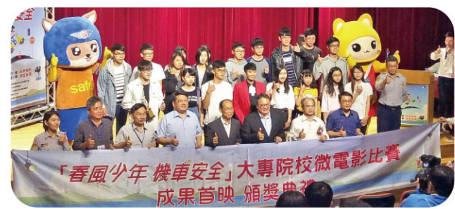
▲各校獲獎學生與師長合影。

交通安全議題深植人心。正如校長趙志揚博士致詞所言，讀嶺東科大不僅習得專業，同學更是幸福與活力。