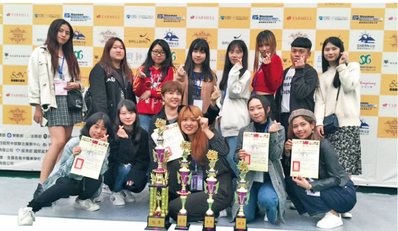
參加「2018年第六屆國際美容美睫大賽」的流設系師生於現場合影。