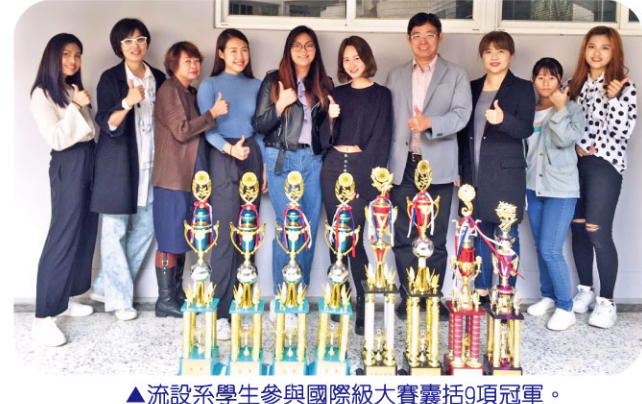
流設系學生參與國際級大賽囊括9項冠軍。