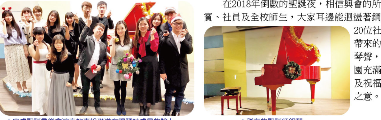
▲完成聖誕音樂演奏的喜悅洋溢在鋼琴社社員的臉上。▲稀有的聖誕紅鋼琴。