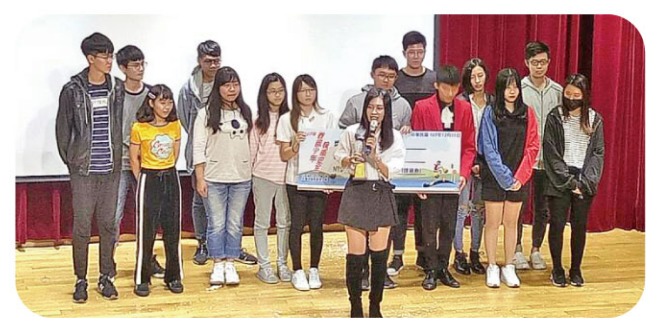
▲數媒系榮獲第一名發表得獎感言。