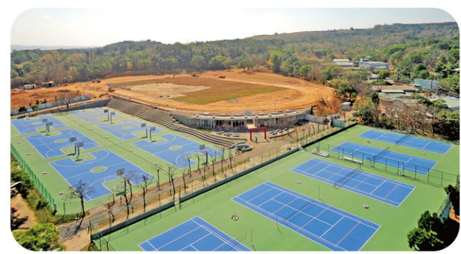
▲本校實文校區田徑場即將完工，嶄新的體育場等你來運動！