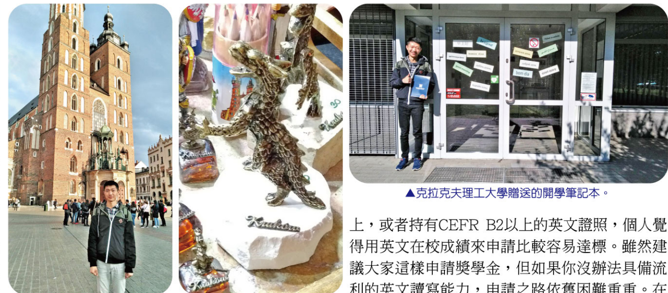
▲波蘭克拉科夫老城區聖亞瑟教堂。▲波蘭克拉科夫傳說中的惡龍。▲波蘭克拉科夫大學贈送的開學筆記本。