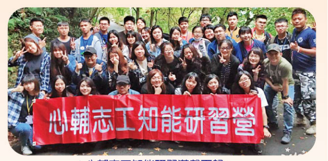
▲心輔志工知能研習高潮而罷。