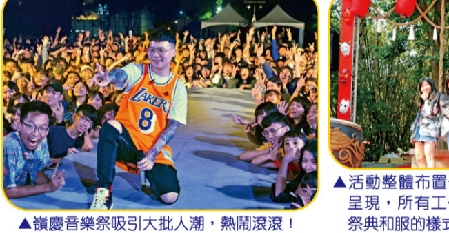
▲嶺慶音樂祭吸引大批人潮，熱鬧滾滾！ ▲活動整體佈置皆以日式祭典風格呈現，所有工作人員的穿著也以祭典和服的樣式穿搭。 ▲音樂祭還有文創市集以及美食攤位可以盡情遊逛。

【本刊訊】往年學生會在12月會安排一系列的聖誕月活動，聖誕演唱會亦包含在內，但今年想帶給新生不一樣的氛圍，所以將演唱會日期提前至校慶前夕10月25日舉辦，而且由室內改為露天演唱會，在寶文校區舉辦熱鬧的嶺慶音樂祭活動。 活動整體皆以日式祭典風格呈現，當天除了架設鳥居、神社等拍照牆外，也在校園的各處掛上燈籠作為活動宣傳的裝飾品，所有工作人員的穿著也以日本祭典和服的樣式穿搭，營造出慶典的熱鬧感受，除了視覺及聽覺的音樂饗宴之外，當天還有文創市集及美食攤位可以遊逛，更添味覺的享受。嶺慶音樂祭突破往年的慣例，以免費入場的方式吸引同學們參與，還邀請了藝人High咖、蕭秉治、熊仔、隨性樂團Random、老王樂隊、告五人等搖滾演出，以露天演唱會形式的呈現，更讓夜晚的寶文校區，在人潮及樂音的迴盪下，越夜越熱鬧！