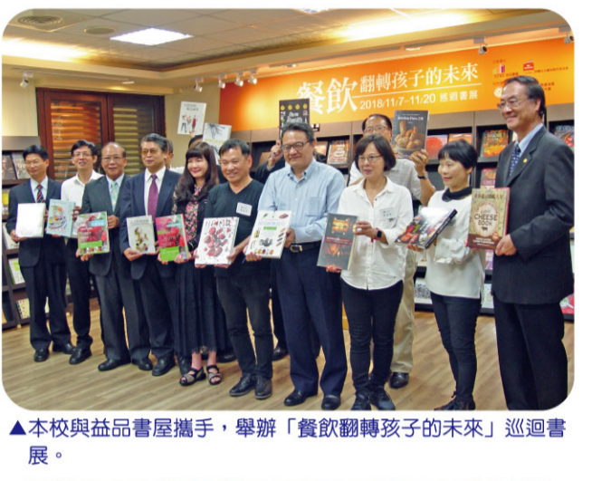
▲本校與益品書屋攜手，舉辦「餐飲翻轉孩子的未來」巡迴書展。 ▲開幕式活動現場有南湖社區大學悠揚的小提琴演奏。 ▲多達400本市面上難得一見的書籍，聚集世界頂尖廚藝、全球知名主廚私房料理等專書，令學子駐足翻閱。