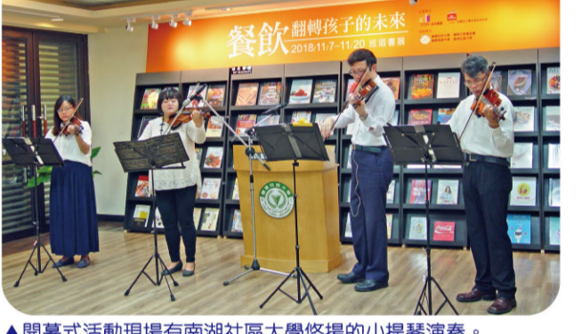
▲本校與益品書屋攜手，舉辦「餐飲翻轉孩子的未來」巡迴書展。 ▲開幕式活動現場有南湖社區大學悠揚的小提琴演奏。 ▲多達400本市面上難得一見的書籍，聚集世界頂尖廚藝、全球知名主廚私房料理等專書，令學子駐足翻閱。