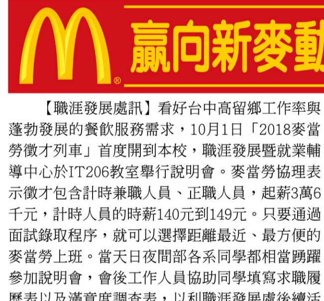
▲職涯發展暨就業輔導中心辦理「2018麥當勞徵才列車」說明會。 ▲職涯發展暨就業輔導中心辦理UCAN新生導覽講座。