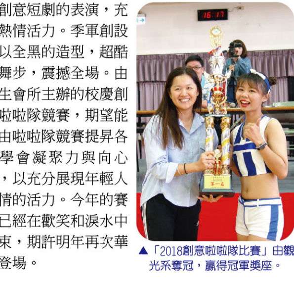
▲2018創意啦啦隊比賽」由觀光系奪冠，贏得冠軍獎座。 ▲配創意短劇的表演，充滿熱情活力。季军創設系以全黑的造型，超酷的舞步，震撼全場。由學生會所主辦的校慶創意啦啦隊競賽，期望能藉由啦啦隊競賽提昇各系學會凝聚力與向心力，以充分展現年輕人熱情的活力。今年的賽事已經在歡笑和淚水中結束，期待明年再次華麗登場。

【本刊訊】啦啦隊比賽一向是嶺東的年度盛事，更是優良的傳統，今年的「從嶺開始-嶺慶創意啦啦隊比賽」於10月19日假亞萍館盛大展開，在團體群眾熱情鼓舞之下，各個參賽隊伍，莫不摩拳擦掌，蓄勢待發，準備舞動嶺東，一舉奪冠，大家同心協力，團結一致，完成這場華麗而精彩的比賽。最後由觀光系奪下2018冠軍寶座、亞軍企管系、季军創設系。 啦啦隊比賽的過程從成軍到練習到上場比賽，都必須歷經一番苦，贏得冠軍的觀光系以整齊畫一的舞步、流暢的音樂節奏、創新的風格帶給觀眾耳目一新的感覺，精彩絕倫的表現，贏得裁判的青睞。亞軍企管系以學生服的造型，搭