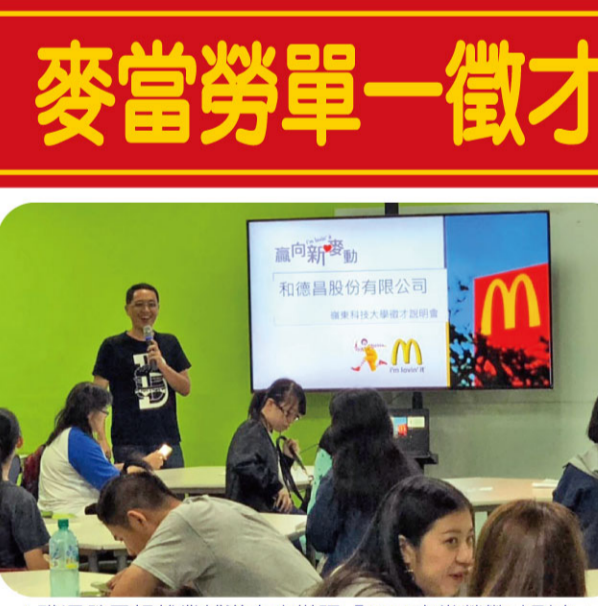
▲職涯發展暨就業輔導中心辦理「2018麥當勞徵才列車」說明會。 ▲職涯發展暨就業輔導中心辦理UCAN新生導覽講座。