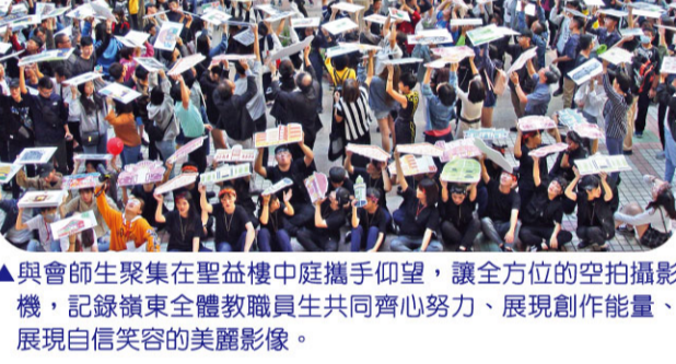
▲與會師生聚集在聖益樓中庭攜手仰望，讓全方位的空拍攝影機，記錄嶺東全體教職員生共同齊心努力、展現創作力量、展現自信笑容的美麗影像。