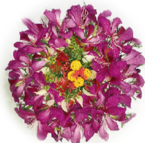
植物曼陀羅-繽紛向榮。

一整天下來參與的老師皆表示收穫豐富，除了學到知識外也帶著花草茶及香氣包回去，與其他同事或家人分享；最感動的是參與的老師從觀察大自然及植物樣態中，回想到自己與學生的互動，及學生面對各種不同挫折、打擊或意外事件時的態度，真切地感受到植物的療癒力量，深深表示可以好好運用今日工作坊所學在未來輔導或教學工作上。