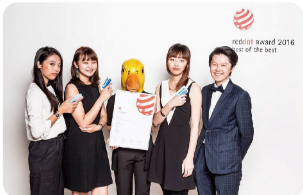
▲ 2016禽報員小組德國紅點柏林頒獎。