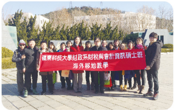
▲ 財政系財會碩士班師生於東北財經大學校門口合照。

值稅的改革，藉由此次移地教學，對於兩岸稅制與財政政策與制度有更深入的交流，學習任務圓滿成功。在歷經零下10度至20度低溫，完成此趟學習之旅，學生們皆對此行表達高度肯定，收穫良多！