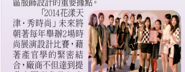
▲本校流行設計系學生參加「2014花漾天津秀時尚」時裝服飾搭配比賽，綻放光芒！