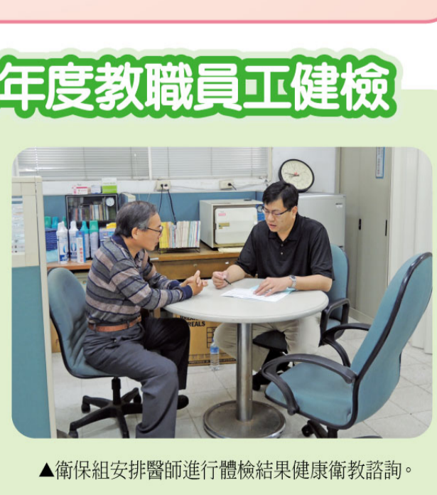
▲衛保組安排醫師進行體檢結果健康衛教諮詢。