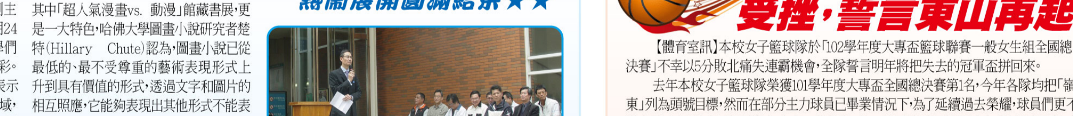
▲「愛心書到部落」活動1至部落幼兒園舉辦故事繪本導讀活動。