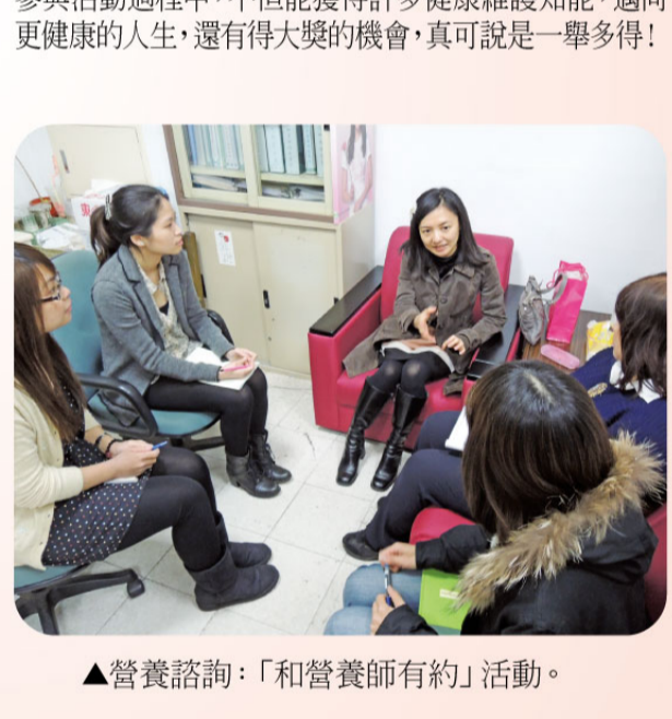
▲營養諮詢：「和營養師有約」活動。