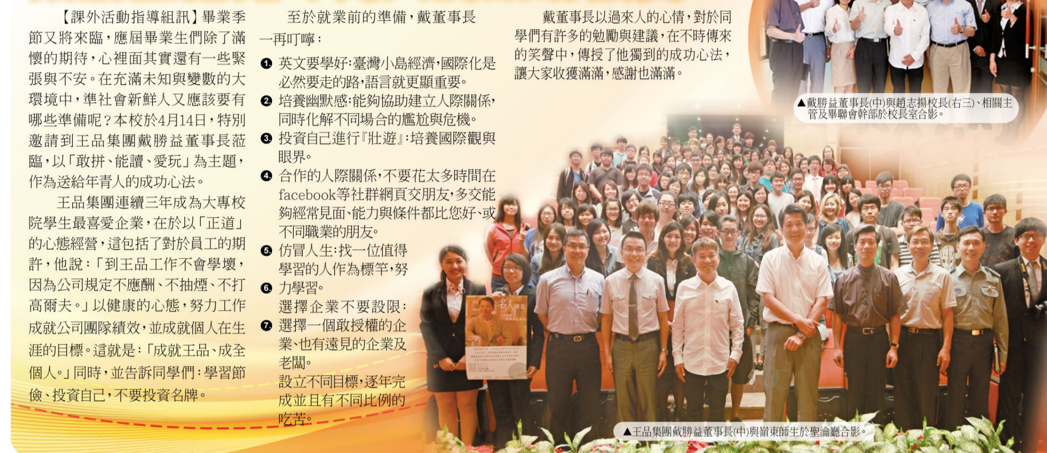
▲王品集團副總裁戴董事長(中)與東師師生於聖約翰會堂合影。