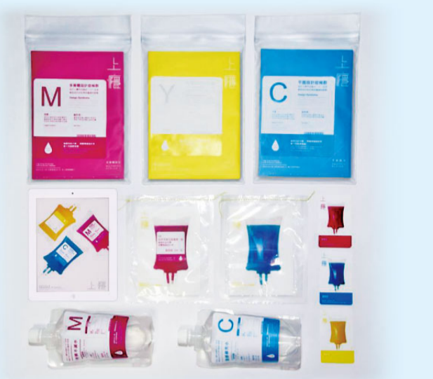
▲2014視傳系主形象「上癮」全商品-專刊、電子書、能量水、電卡