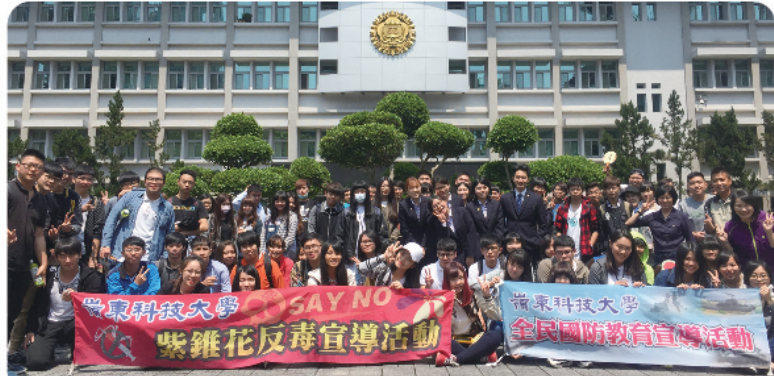
▲ 反毒參訪結合全民國防教育收穫豐碩。