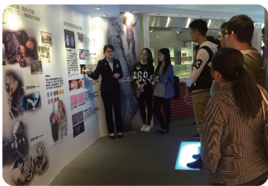
▲ 聽取毒品對人體器官危害的說明。