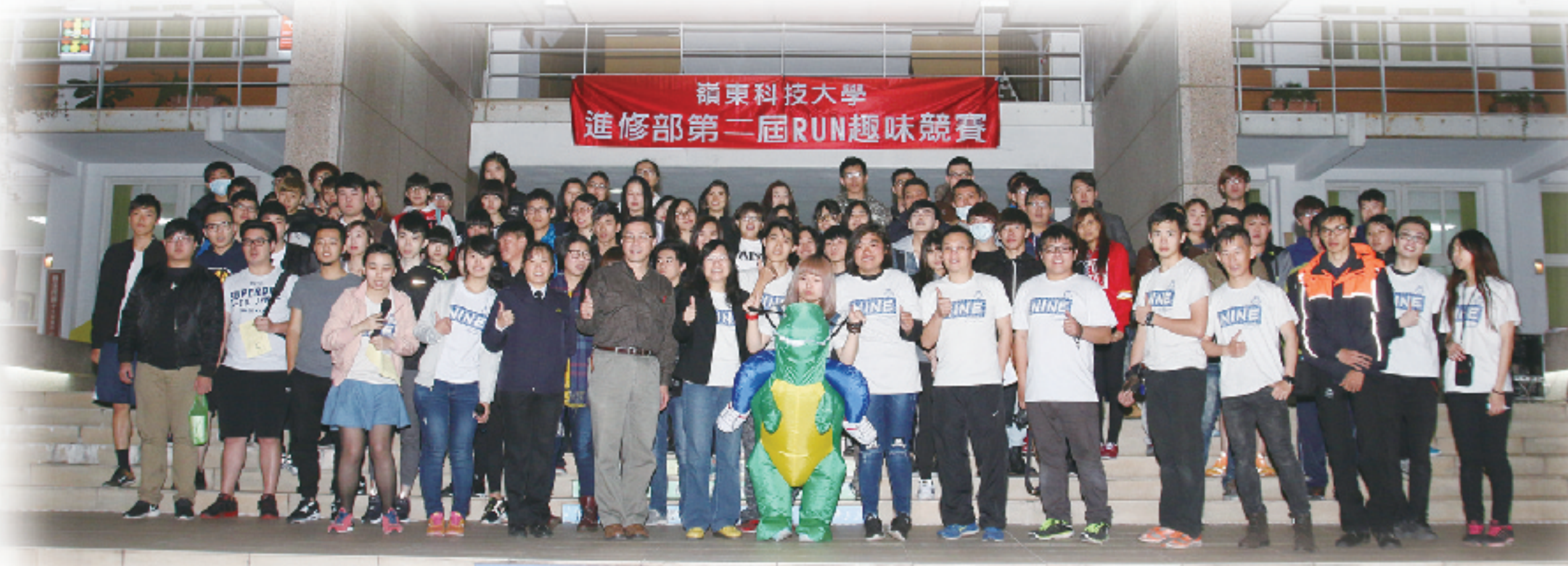
▲ 參與人員及全體工作人員大合照。

此次活動也感謝進修部同仁的全力協助，更在活動當天全程參與，與同學們同樂，並在活動結束後，給予主辦的進修部學生會幹部們，極佳的讚賞。「進修部第二屆RUN嶺東趣味競賽」圓滿落幕，接下來還有許多精彩活動，進修部第九屆學生會暨全體社團幹部，竭誠歡迎同學們一起來參加喔！