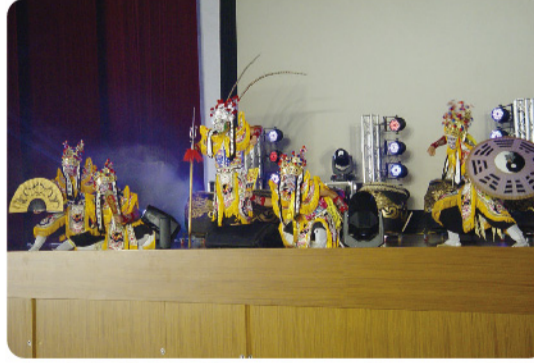
▲ 穿著華麗刺繡大袍，拿著刑具和令牌的「官將首」演出，令人心中升起一股由衷的敬意。