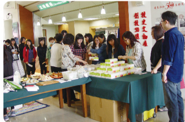
▲ 體驗課程結束後並致贈與會者輕食餐盒一份，讓所有人皆滿載而歸。