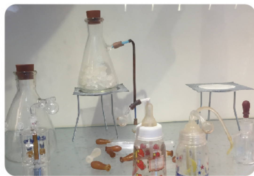
▲ 五花八門的安非他命吸食器。