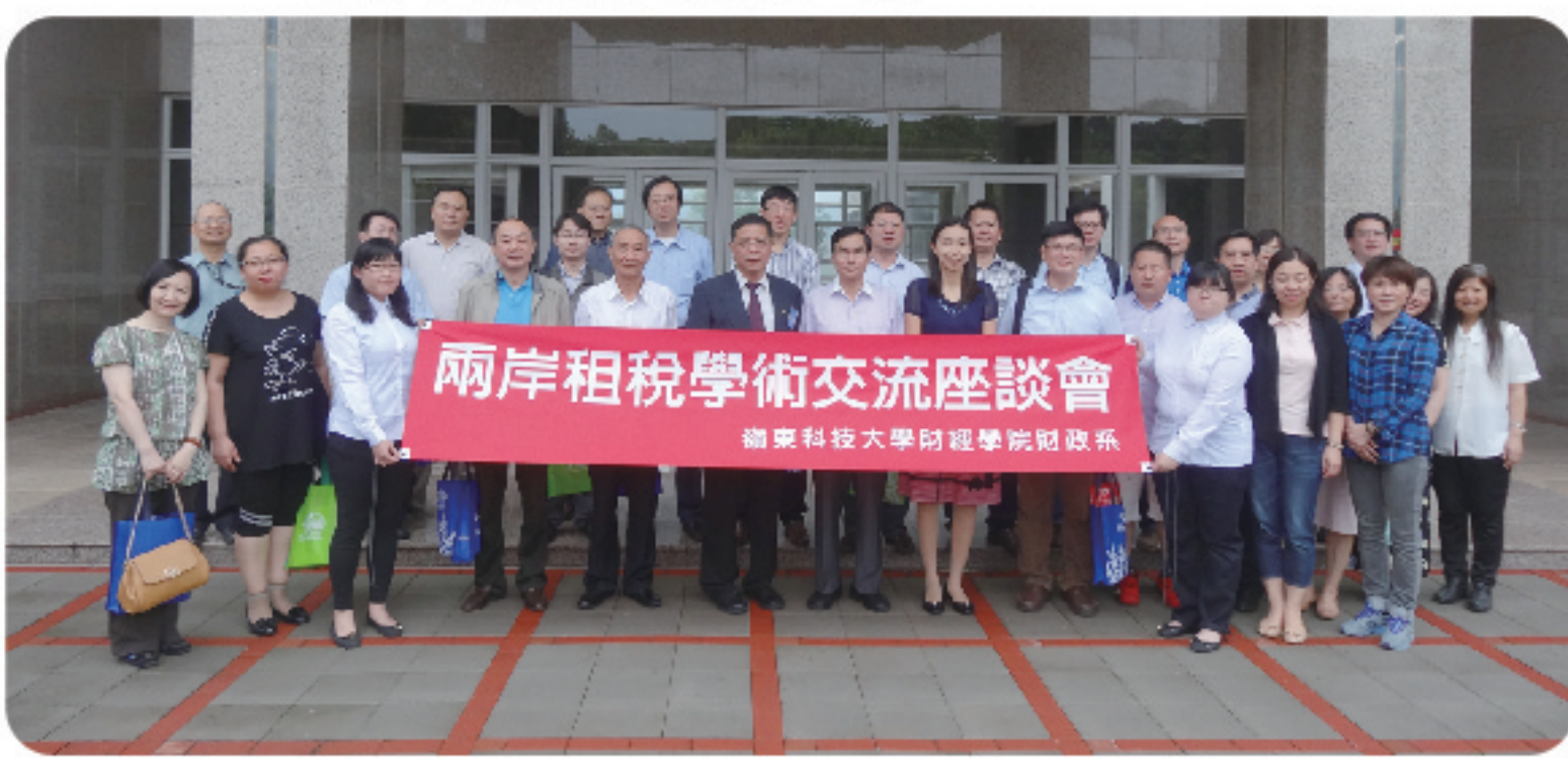
▲ 財政系舉辦「兩岸租稅交流座談會」邀請兩岸租稅專家學者齊聚一堂。