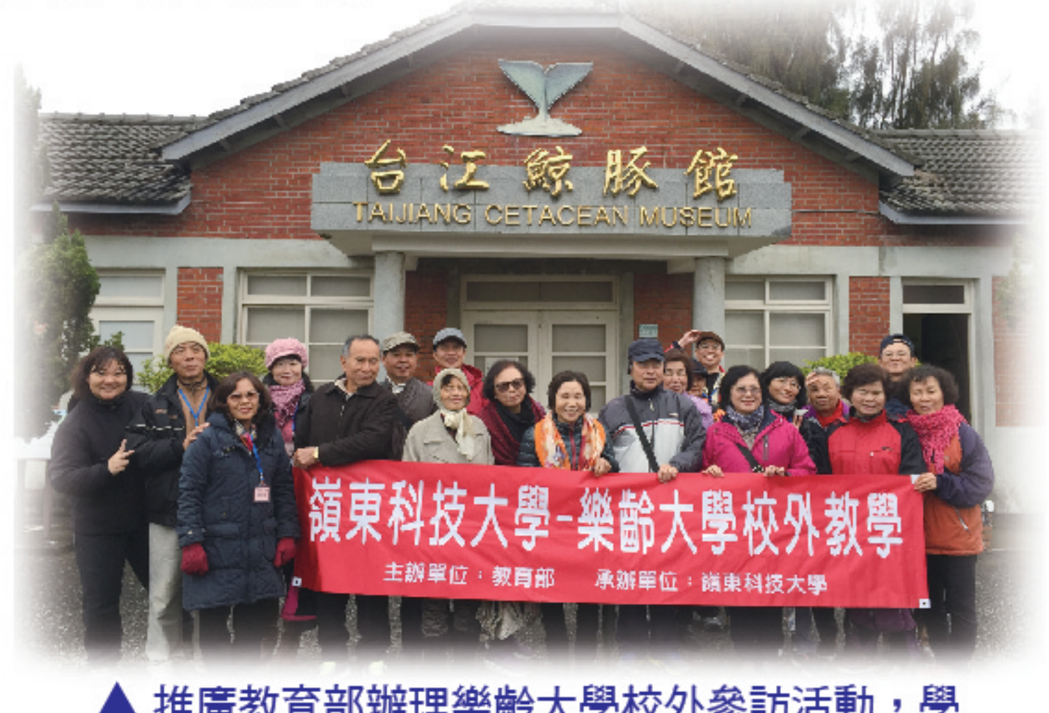
▲ 推廣教育部辦理樂齡大學校外參訪活動，學員們直呼收穫滿載。

如何在經濟發展與環境永續保護中取得平衡，實為一重要課題。黑面琵鷺生態保護區能夠成為聞名國際的賞鳥勝地，是許多人辛苦付出累積的成果。自然環境資源保護不僅僅是政府責任，更是全民大眾的義務。此行也順道安排學員們參觀北門濱海風景區、四草野生動物保護區、鹽田生態文化村以及當今熱門景點水晶教堂，學員們直呼收穫滿載。學員們都對本次推廣教育部所安排的參訪行程表示肯定和感謝，長途跋涉雖然造成身體疲憊，但精神和心靈卻是相當豐碩、富足。