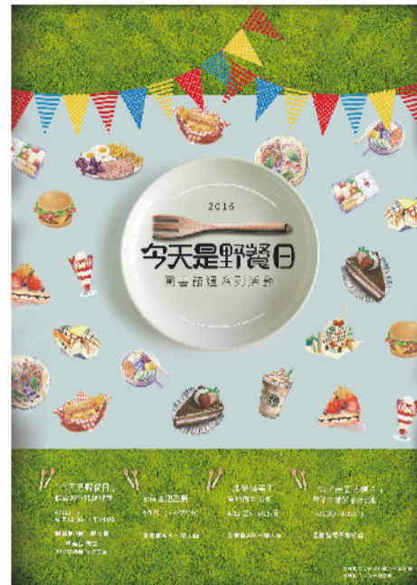
▲ 今天是野餐日—本校「105年圖書館週系列活動」圓滿落幕。

圖書館推動「105年圖書館週系列活動」的用意，就是希望引領更多讀者，藉著活動的參與，多多利用館藏資源，期許讀者能徜徉文學的無言之境，品味文字的藝術之美，用閱讀讓自己的視野更開闊！