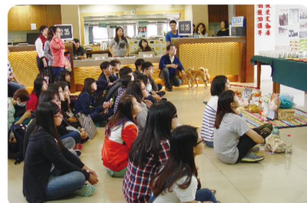
▲ 現場觀眾聚精會神聽講。