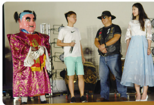
▲ 扮相討喜的「招財進寶童子」與觀眾互動熱絡，現場尖叫聲連連。