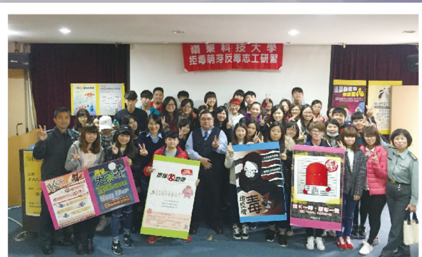
▲ 反毒志工培訓快樂大合照。