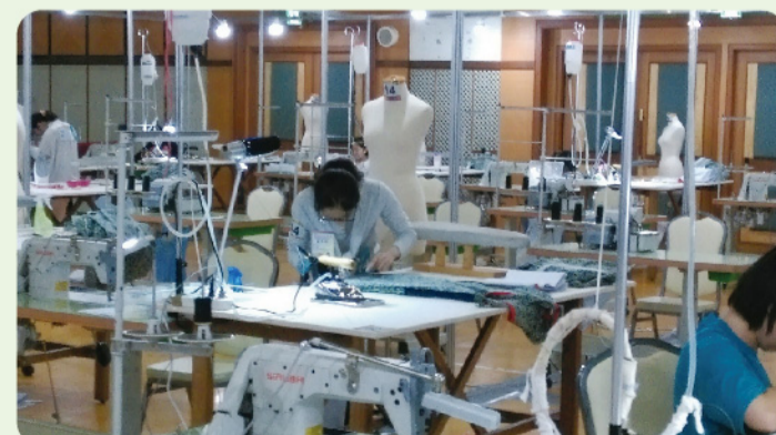
▲ 大會競賽會場-選手競賽過程。