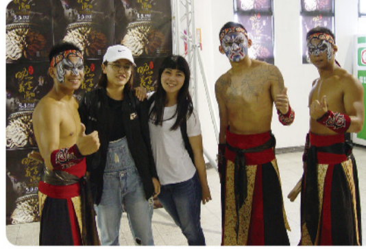
▲ 九天民俗技藝團藝術工作者於演出後與觀眾合影。