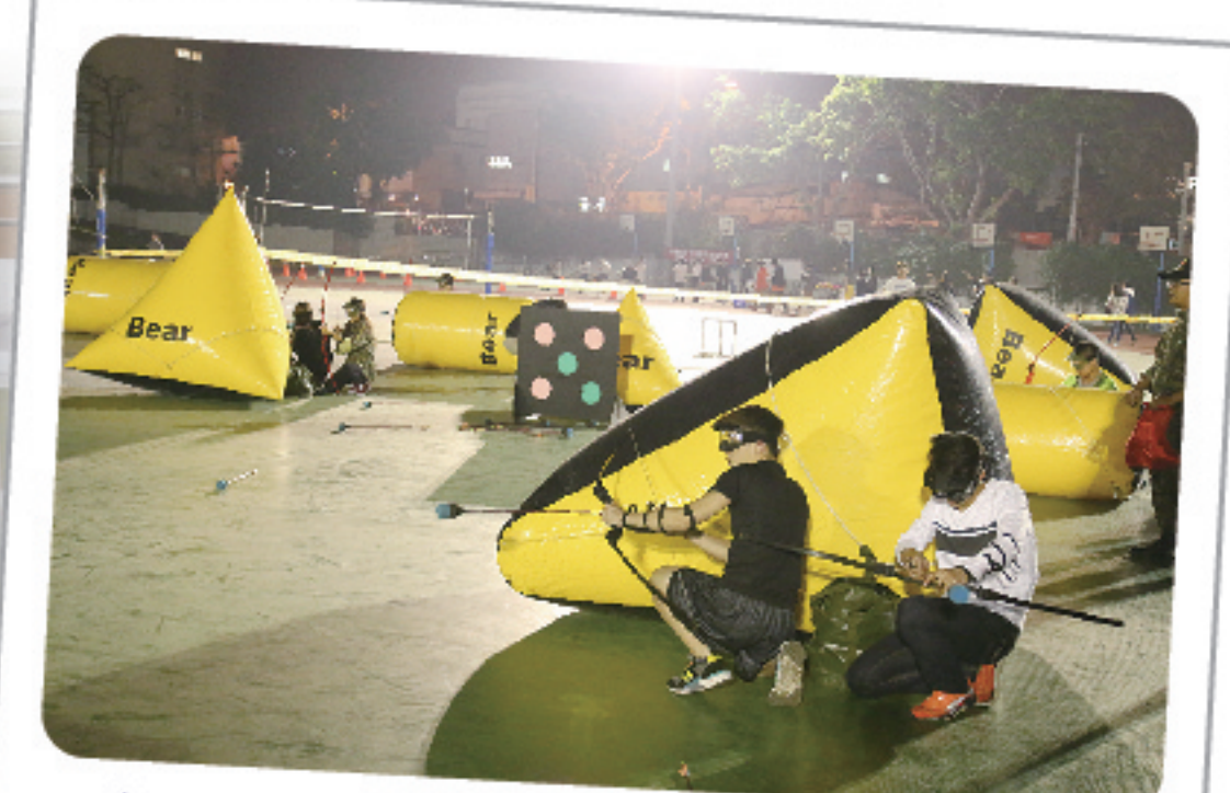
▲ 「咻～！噢？怎麼會有人在學校裡射箭？」原來是「進修部第二屆RUN嶺東趣味競賽」項目之一「愛的啾比特」。