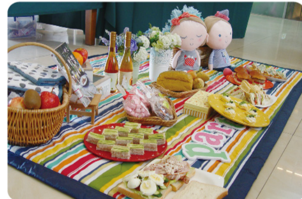
▲ 一道道色彩繽紛亮麗，色香味俱全的輕食料理，讓人垂涎三尺。