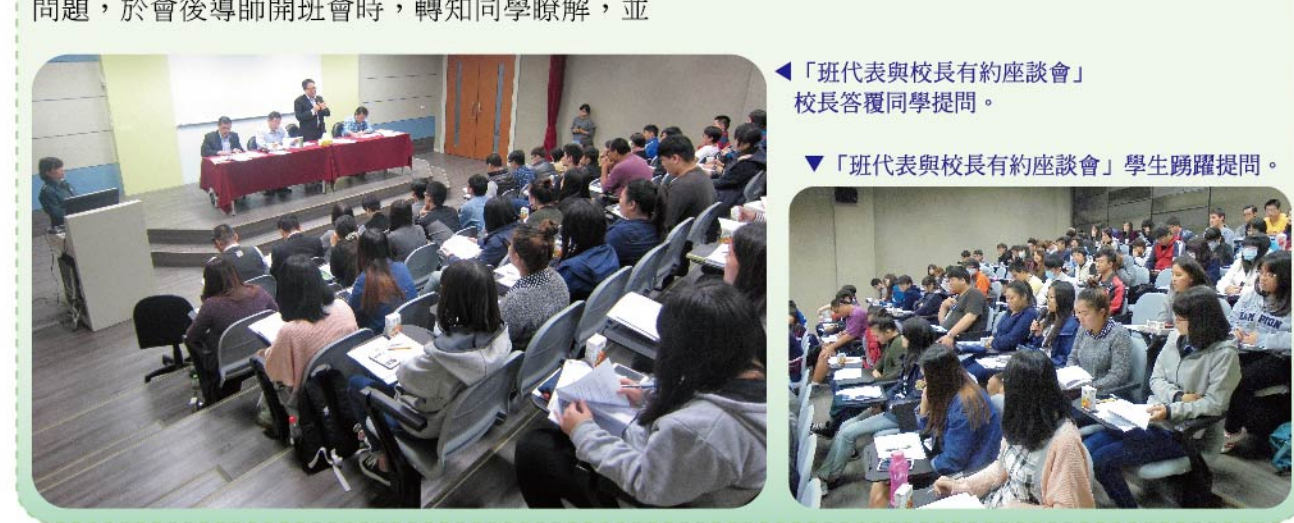
▲「班代表與校長有約座談會」學生踴躍提問。

【生活輔導組訊】本校學生事務處生活輔導組於104年12月9日假亞洋館一樓全人教育實踐活動中心舉辦「班代表與校長有約」座談活動，全校各班班代表踴躍參與，活動圓滿順利。座談活動由校長趙志揚博士親自主持，並邀請相關業務主管與會，與同學面對面溝通，以瞭解同學學習狀況及生活情形，並增進同學對校長治校理念及本校中長期發展計畫之認知，以凝聚向心力。當天會議資料，除彙整本學期各班班會紀錄反映事項外，尚有針對此次座談會，發給各班，於班會討論出有建設性的建議事項，經由生活輔導組彙整相關行政單位答覆後付梓，於開會時發給與會班代表，希望各班班代表將本次會議討論問題，於會後導師班會時，轉知同學瞭解，並請班上同學將需要與學校配合改善的事項，一起努力改善，期使班代表作好學校與同學間良性溝通的橋樑，全體師生團結一心，共同學習成長。