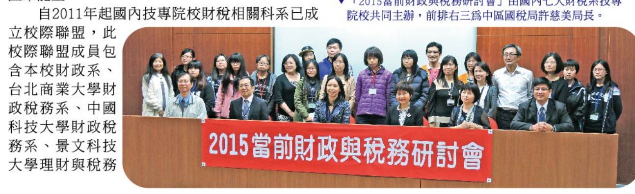
▲「2015當前財政與稅務研討會」由國內七大財稅系專院校共同主辦，前排右三為中國國稅局許慈美局長。

【財政系訊】「2015當前財政與稅務研討會」於2015年12月4日假本校實文校區知源教學大樓國際會議廳舉行，並圓滿完成。會議中進行三場演講與15篇論文發表，本次研討會邀請財政部中區國稅局許慈美局長、台灣經濟研究院林建甫院長，與政治大學財政學系黃明聖教授蒞臨演講，演講主題涵蓋稅收改革、金融稅務制度與地方財政管理。藉由此次研討會，提供財政稅務領域專家學者之意見交流平台，汲取政策改革新知，透過技職院財政稅務領域的聯盟夥伴關係匯聚能量。