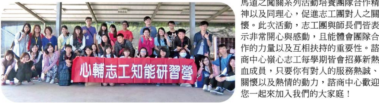
▲諮商中心嶺心志工團辦理「突破自我-探索體驗活動」。

活動包括團隊建立、自我覺察、冒險樹林之溝通訓練，以及志工團共同帶領的營火晚會，活動內容多元化且生動活潑。此外，也透過東豐鐵馬道之相關系列活動培養團隊合作精神以及同理心，促進志工團對人與自己之關懷。此次活動，志工團與師長們皆表示非常開心與感動，且能體會團隊合作的力量以及互相扶持的重要性。諮商中心嶺心志工每學期皆會招募新熱血成員，只要有對人的服務熱誠、關懷以及熱情的動力，諮商中心歡迎您一起來加入我們的大家庭！