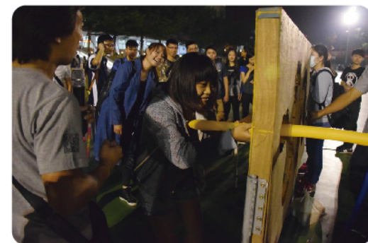
▲電流急急棒氣球版。