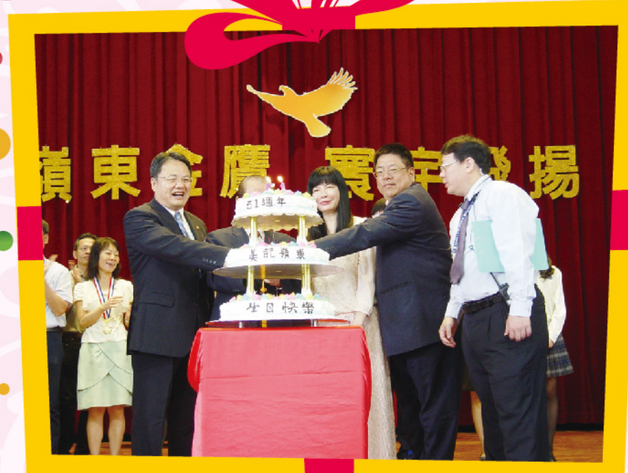
▲在生日快樂歌聲中與會貴賓切蛋糕祝嶺東生日快樂。

【本刊訊】為了慶祝51週年校慶，本校於10月28日（星期三）舉辦校慶慶祝大會，除了亞萍館有慶祝大會之外，校園內並有運動會、手手市集、嶺慶夜市、社團動態表演展等活動，當天更推動全校制服日，學生們穿著高中、職制服，穿梭於校園內，氣氛熱鬧非凡。