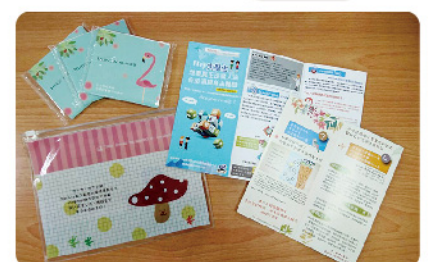
▲ 歡迎全校師生前來諮商中心索取活潑具設計感的文宣品！

解生活當中所遇到的困難及挫折，同時也讓師生們能更瞭解諮商中心的各項資源。除了色彩活潑的圖像式DM之外，諮商中心也製作多功能的塑膠收納袋及面紙，上面印有可愛圖案及正向小語，時時刻刻激勵師生，學習用樂觀正向的角度看世界、他人及自己，歡迎全校師生前來諮商中心索取相關文宣品！