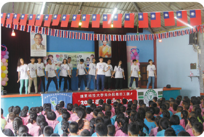
▲ 本校海外志工團已在泰北深耕8年，熱心奉獻。

這次參與本校海外服務志工團，不禁讓我人生有許多感慨。遠在泰國北部有一代隸屬中華民族的血統，默默為生存而戰，歷經戰爭的摧殘，泰、緬文化的衝擊，至今仍傳承中華文化，尤其近90多所中文學校默默耕耘，來自各地志工們的熱心教導，看到建華中學所舉辦的演講比賽、毛筆競賽等，讓身為老師的我，為之動容。來此地，不是追求成功，而是體驗與學習，經歷了二十六天的洗禮，我不僅體驗深刻，而且學習更多，令我不虛此行。