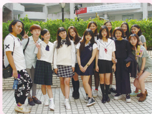
▲校慶當天推動全校制服日活動，學生們穿著高中、職制服，穿梭於校園內，青春洋溢。