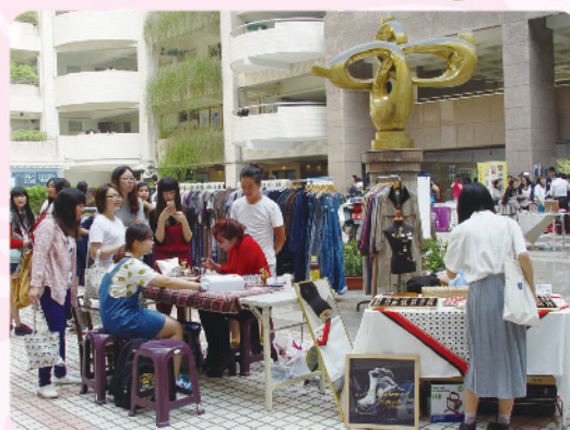
▲主打文創商品的手手市集，吸引許多人潮駐足選購。