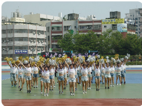
▲ 熱力四射的冠軍啦啦隊行銷系。