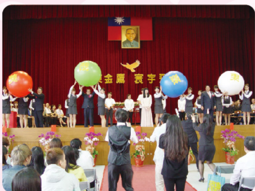
▲「祝福歡唱 嶺東飛揚」將典禮氣氛推至最高點！