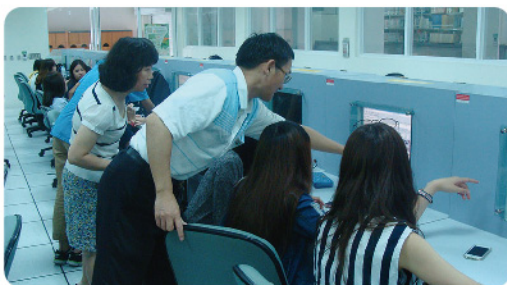
▲ 日間部新生於圖書館四樓「圖書資訊素養教室」進行線上導覽。