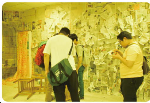
▲「校長的大秘寶」密室逃脫。