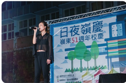
▲ 藝人林芯儀壓軸演唱。

【本刊訊】今年校慶園遊會有別於往年，歡樂的氣氛從白天延續到夜晚，為了讓進修部同學也有參與的機會，名為「嶺慶夜市」的園遊會在下午四點便陸續進駐木棧道，各式各樣五花八門的攤位，吃喝玩樂一應俱全，讓人目不暇給，有種走入一中夜市的錯覺。因為本次活動亦定義為制服日，所以在華燈初上時，一大群穿著高中、職制服的同學與師長們，就以熱鬧的踩街遊行揭開「嶺慶夜市」的序幕，並請來新宅男神田心蕾、陳艾琳主持下午活動，除了有精彩的動態社團表演節目之外，還邀請歌手林芯儀獻唱，現場氣氛熱鬧無比，「嶺慶夜市」帶給了進修部同學全新的校慶歡樂氣息。