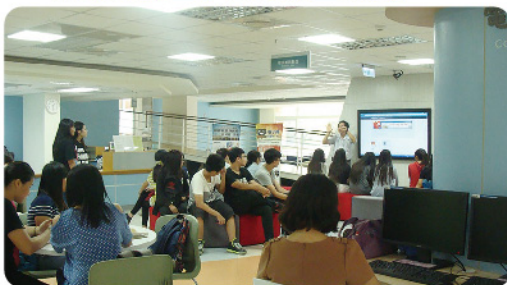
▲ 進修部由值班館員進行實地導覽。

【圖書館訊】104學年度新生導覽活動已於104年9月21日(星期一)至10月19日(星期五)舉辦完成，總計有52個班級約2300多名的新生同學參加，包括日間部36班及進修部16班。