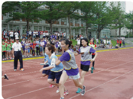
▲ 場上每位選手無不卯足全力為系上爭取佳績。