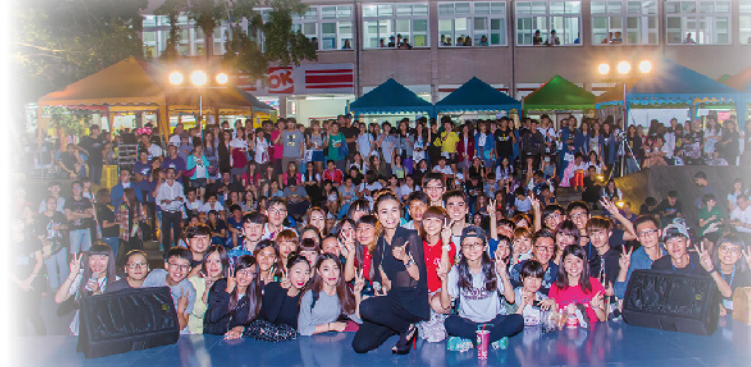
▲ 嶺慶夜市歡樂大合照。