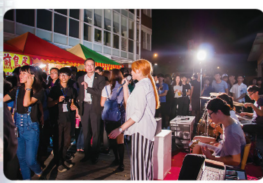
▲ 「嶺慶夜市」熱鬧登場，熱音社於夜市演唱。

【本刊訊】今年校慶園遊會有別於往年，歡樂的氣氛從白天延續到夜晚，為了讓進修部同學也有參與的機會，名為「嶺慶夜市」的園遊會在下午四點便陸續進駐木棧道，各式各樣五花八門的攤位，吃喝玩樂一應俱全，讓人目不暇給，有種走入一中夜市的錯覺。因為本次活動亦定義為制服日，所以在華燈初上時，一大群穿著高中、職制服的同學與師長們，就以熱鬧的踩街遊行揭開「嶺慶夜市」的序幕，並請來新宅男神田心蕾、陳艾琳主持下午活動，除了有精彩的動態社團表演節目之外，還邀請歌手林芯儀獻唱，現場氣氛熱鬧無比，「嶺慶夜市」帶給了進修部同學全新的校慶歡樂氣息。