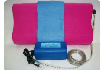
▲榮獲金牌與印尼特別獎的「具有舒緩效果之氣動裝置」作品。