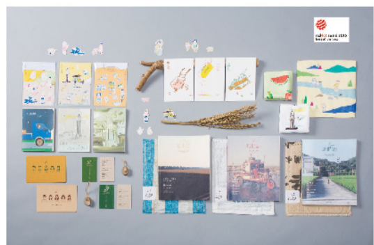
▲ 「最佳獎」(Best of the Best)【培根誌】整體作品。