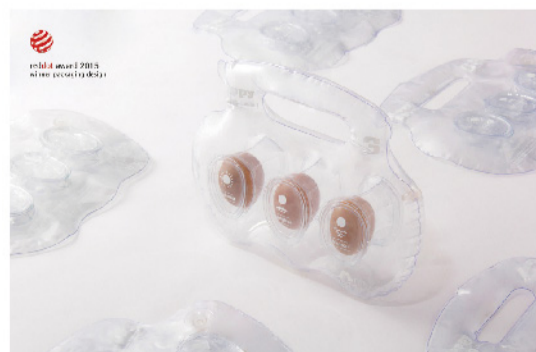
▲ 「紅點獎」(Red Dot)【樂蛋】獲獎作品。