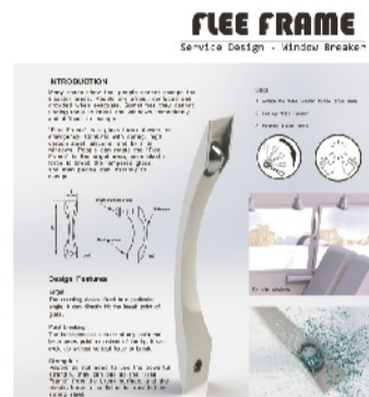
▲銅牌作品「彈性擊破裝置」參展海報。