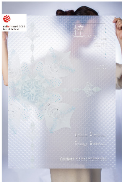
▲ 「最佳獎」(Best of the Best)【粹】形象海報。

作為設計菁英的夢想基地，培養具有創意思考力的問題解決者，透過具有國際觀的設計美學訴求，以多元實踐的能力，呈現具競爭力的成果，是本校設計學院的培育方向與重點。紅點競賽新銳設計師的獲獎不僅是對新銳設計師專業的認可，更是對本校在培養設計人才成果的肯定。趙志揚校長表示：「此次獲獎凸顯出嶺東科大在世界設計百大學校的重要位置，未來學校將投入更多的預算在設計學院的硬體與軟體上，以提升學生的國際競爭力與能見度」。