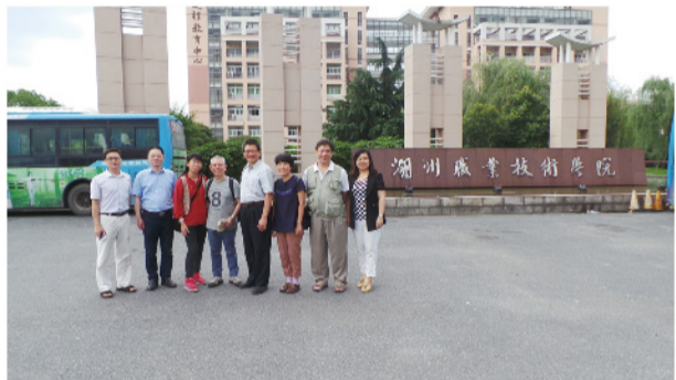
▲參訪團在湖州職業技術學院校園內合影。