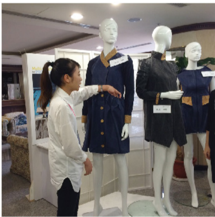
▲同學在媒合廠商面前解說設計作品的情形。