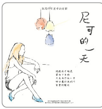
▲「尼可的一天」海報及光碟封面。

果。「尼可的一天」微电影以第一人稱的形式，講述嶺東校園裡的一份子-尼可的一天生活。藉由他日常一天所觀察到的人、事、物，串起三個主要性平議題：過度追求、性別刻板印象與同性之愛；每個主題約3分鐘，總片長約10分鐘，希望引起學生對性別平等的共鳴，達到宣導的效果與省思的目的。「尼可的一天」從劇本、演員、演出到光碟封面設計，均是由本校學生獨立完成，絲毫沒假外人手。在這群積極、熱情與聰穎的嶺東伙伴共同努力下，才得以有這部「尼可的一天」微电影誕生。雖不是什麼經典大作，但卻是同學們辛苦的結晶。目前微电影光碟仍有數量，歡迎有興趣的老師或同學至諮商中心免費索取，共同與「尼可」度過美好的一天。