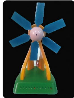
▲金牌作品「水平式風力機葉片可調式安裝角機構裝置」。

這些獲獎作品，都是國內首見創新發明的產品，未來更有機會進一步達成產學合作，提升民眾的生活品質，而這也充分展現嶺東科大為產業最佳合作夥伴之具體成果。