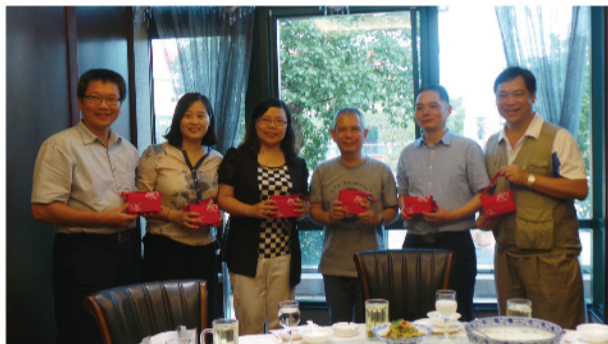
▲參訪團致贈本校觀光系學生設計的客家花布小禮物。