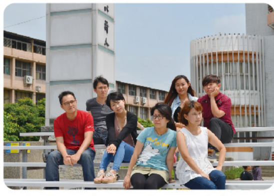
▲「尼可的一天」演員及工作人員。