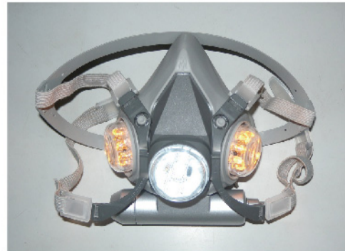
▲ 金牌作品-緊急逃生面罩。