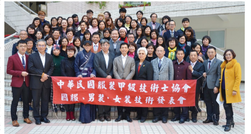
▲ 「男士手工西服製作」&「衣藝術」就在校流行設計系。

感受到不懈怠的態度與專業技法，令人敬佩。流行設計系將持續培育「時尚工作者」，連結技術、技能與態度的養成，確實呼應產業需求，以提升學生就業競爭力。