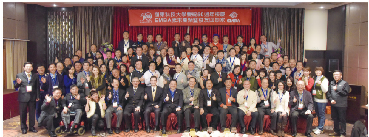
▲EMBA舉辦「年終團聚暨校友回娘家」，活動精心設計規劃，讓校友感動。