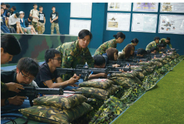
▲步槍模擬射擊體驗。

在享受鐵馬道的風景之餘，我想到這次校外參訪的意義，主要目的是了解陸軍各類型火炮、營區環境、體驗軍事訓練課程並鍛鍊自我體力。砲指部參訪，提供一個選擇未來的方向與機會；火炮及輕兵器操作體驗，增進對陸軍現役武器的了解及體會軍人保國衛民的辛勞；自行車道騎腳踏車鍛鍊體力，為了將來做好準備...等。總而言之，此次全民國防課程校外教學活動蘊含豐富的教育意涵，讓我增長國防知能及體驗，獲益良多。