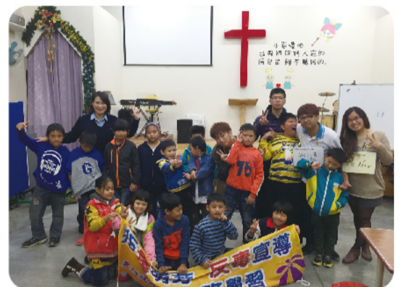
▲ 拒毒萌芽反毒志工與學童開心合影。