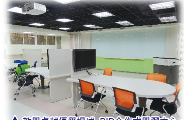
▲ 教學卓越優質場域- BID合作式學習中心。