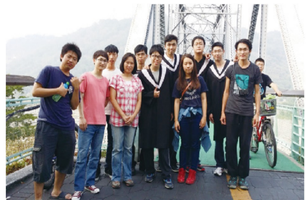
▲「后豐鐵馬道」花樑鋼橋合影留念。