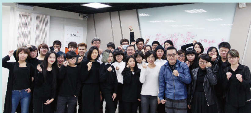
▲ 「嶺東科技大學設計週·蘋果4.0」寒假設計營學生與老師們合影。

【設計學院訊】設計學院在103學年度首次舉辦，由視傳系、數媒系、流設系及創設系四系共同承辦的「嶺東科技大學設計週·蘋果4.0」，從3月25日至31日為期一週，內容包含四系聯展、畢業總審、走秀、市集、系列演講與多場活動。本次主題訂為：「蘋果4.0」，除了有結合四系、升級等意涵外，並透過創世紀的「智慧果」、萬有引力的「頓悟果」、賈柏斯的「創意果」，為前三顆蘋果，引導出新一代設計學子的第四顆「希望之果」。