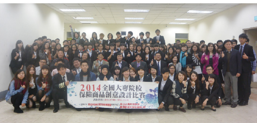
▲ 「2014全國大專院校保險商品創意設計比賽」，決賽隊伍全體大合照。

「2014全國大專院校保險商品創意設計比賽」，共有全國10所大學生組成28隊晉級總決賽。評審委員表示，學生作品在商品保費精算與法規層面仍有改進空間，但創意發想有助於業者開發設計新保險商品。而參賽同學藉由競賽將理論與實務結合，進而驗證自己所學，才是舉辦活動的宗旨以及學習的態度與目的。