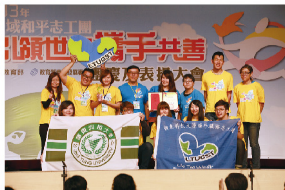
▲全國績優志工團隊，本校學生再度獲肯定。

【綜合規劃處訊】本校海外服務志工團長期推動臺北教育關懷服務，參加教育部青年發展署「103年青年志績優團隊全國競賽」，在141組參賽團隊中脫穎而出，再度獲得肯定，榮獲國際志工服務類第三名，是全國國際志工服務類「唯一」入圍獲獎的「科技大學」！