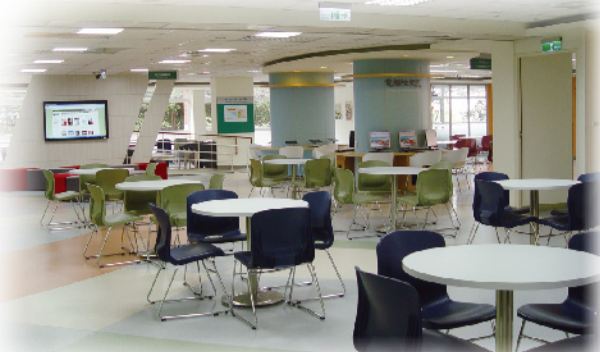
▲ 教學卓越優質場域-圖書館學習專區。

趙校長表示，本校堅持商管設計科技人才之培育理想，藉由全校師生的努力，以及歷年教學卓越計畫所累積的卓著績效與能量，定能達成「嶺東菁英·就業即讚」教學卓越永續發展的目標。