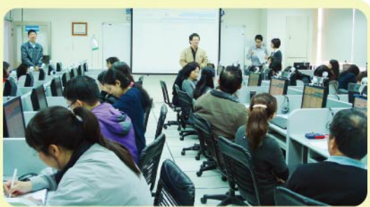
▲學術發展中心舉辦會議管理系統教育訓練。

【學術發展中心訊】為了配合「教學卓越計畫」，積極推動校內各項行政程序的電腦化，以提升行政效率，學術發展中心特於101年3月1日上午於CY201電腦教室，舉辦全校性教學及行政單位的會議管理系統教育訓練。