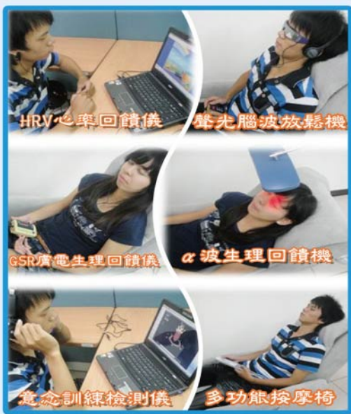
▲諮商中心春安校區「Oh Ya 陽光屋」提供多元化的抒壓方式，讓您可以抒壓FUN輕鬆唷！

「Oh Ya 陽光屋」開放歡迎全校師生踴躍預約體驗，預約申請單可至諮商中心索取或上諮商中心網站下載。