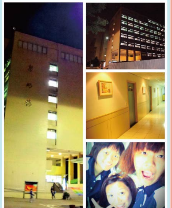
▲「黎明樓」我可愛的家。

宿舍是家，是我們的狂歡聖地，更是我們建立友誼的橋樑，我們之間的感情是由宿舍緣起，所以我最喜歡的地方是宿舍，我會珍惜與姐妹相處的分