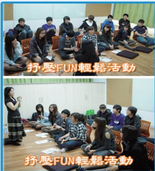
▲寶文校區「Oh Ya 陽光屋」「抒壓FUN輕鬆」活動。