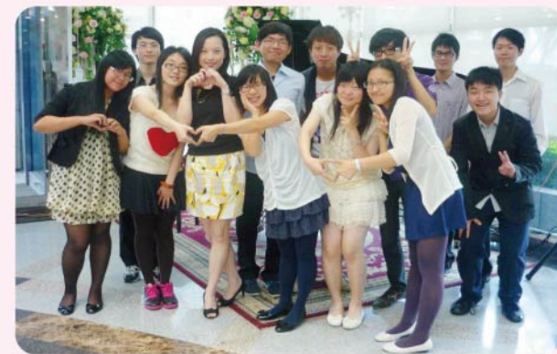
▲鋼琴社全體表演同學與指導老師在會後開心大合照。