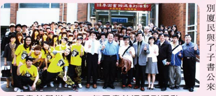
▲圖書館舉辦「101年圖書館週系列活動」，提供本校師生一場豐盛的藝文饗宴。

【圖書館訊】本校圖書館於101年3月19日至23日舉辦「101年圖書館週系列活動」，今年活動共有十大主題，內容豐富而多元，提供本校師生一場豐盛的藝文饗宴。