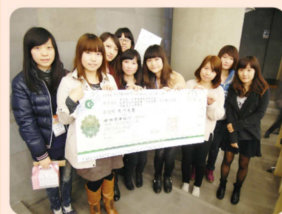
▲財務金融系同學於中區分區複賽榮獲第五名，獲得八千元獎學金。

【財務金融系所訊】由臺灣證券交易所舉辦的「校園證券投資智慧王競賽」，目的在於提升大學生對目前證券市場上的認知。為了讓同學建立投資概念，並對證券市場方面的專業知識進行發揮，財金系相當重視同學將課程所學之金融理論活用於實務，並鼓勵同學要充分掌握證券市場即時的審查規範、管理機制、交易法規、解讀財金資訊等，因此，此次「第九屆校園證券投資智慧王競賽」獲得財金系師生熱烈迴響，本系報名隊數不僅居中區之冠，更是全國之冠。而財務金融系同學參加此次競賽，無論是初賽及複賽亦都獲得不錯的表現。以下為獲獎相關訊息：