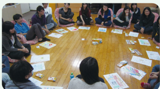
▲ 嶺東學子們透過心靈圖卡開啟正向能量！

透過彼此間的交流與了解，相信這趟旅程的最後大家都找到屬於自己「心」的方向，重燃對生命的熱情，體驗自我的真善美！