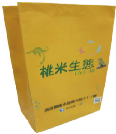
▲團隊為桃米社區所設計具有當地特色而且美觀環保的創意紙袋。