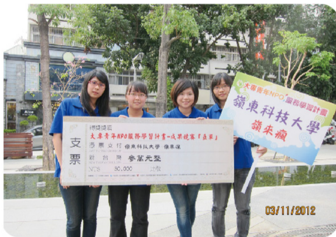
▲嶺東『嶺』來瘋在成果競賽共50餘隊的全國績優隊伍中獲得了亞軍的殊榮。