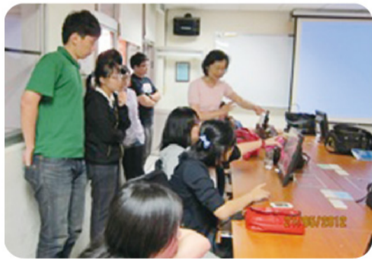
▲團隊成員研究討論照。

本人指導學生6人組團參加行政院勞工委員會職業訓練局中彰投區就業服務中心所推動的「101年度大專青年NPO服務學習計畫」，對南投縣埔里鎮偏遠的非營利事業組織「桃米社區發展協會」進行長達七個月的服務學習歷程，指導學生服務學習十多次發現，桃米社區發展協會欠缺專業資訊人員，同時資訊素養與資訊使用能力相當不足，在許多工作推動上存在著嚴重的數位落差，因此，本團隊以自身資訊專業能力從事服務學習，讓青年學子運用所學參與社區與非營利組織發展，並提供非營利組織發展所需之專業能力，幫助該單位的同時，同時也提升品德教育。