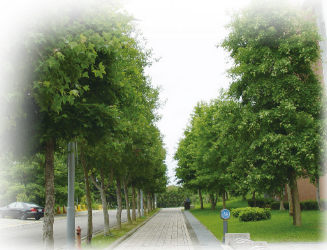
▲ 寶文校區林木茂密擁有豐富的自然生態環境。

下次走在寶文校區時，別忘了多注意一下，是否有隻小松鼠正在注視著您！也請大家不要太噁，不要嚇跑了牠！（文/行銷與流通管理系陳君杰助理教授）