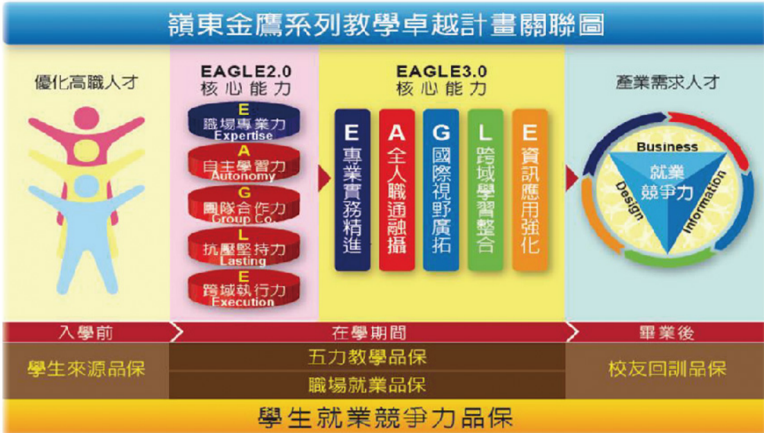
▲ 本校102-103年度教學卓越計畫理念。

本計畫的特色為 (一) 依學生入學前、在學中及畢業後三大階段進行相對應之機制規劃、策略實施及檢核回饋：1. 學生來源品保— 在學生入學前，協助高中職認識職涯、優化教師教學，掌握學生的特質與起點行為，以確保生源品質。2. 五力教學品保與職場就業品保— 在學生就學期間，持續深化EAGLE五力教學品保措施，更於學習過程中強化生涯探索機制、職涯發展課程、職場實習體驗及