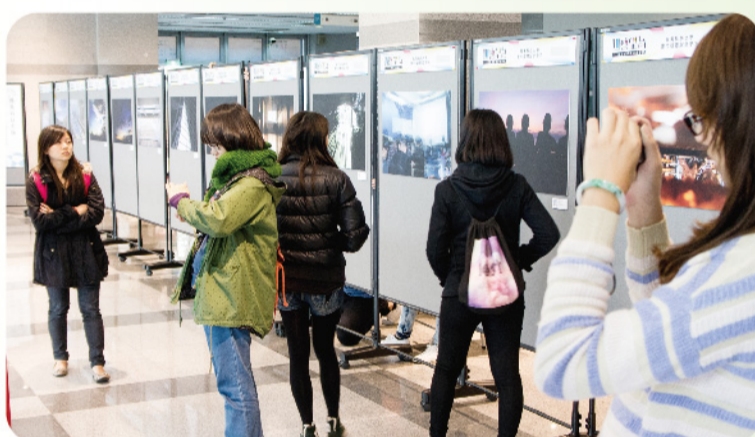
▲本校數位媒體設計系大一學生展出基礎攝影課程作品。

此次展覽日期為元月四至七日，於臺中科技大學中商大樓一樓展覽廳展出，其中參展作品表現豐富多元，主要範圍則為一年級基礎設計、繪畫、平面設計、基礎攝影等相關課程的平時作業或練習，各系均從課程中嚴選出15件優良作品參加展出，並藉由展演能夠分享同學們基本的手繪能力與技法表現，最終目的希望能強化同學間觀摩學習，相對也讓同學及早熟悉展演活動的企劃與執行經驗。