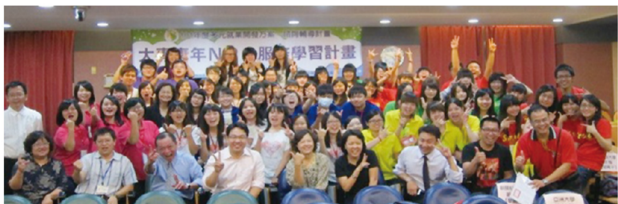
▲行政院勞工委員會所舉辦的「101年度大專青年NPO服務學習計畫」全體參賽人員大合照。