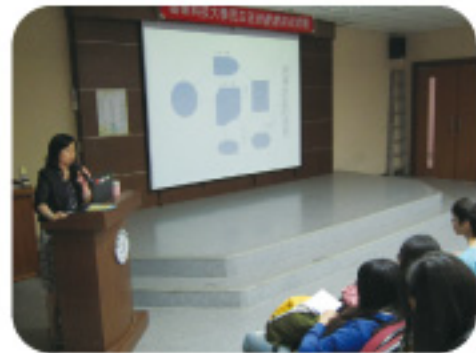
▲ 李翠玲主任檢察官提醒同學，唯有增加自我防衛意識，方能降低被詐騙及誤購法網的機率。

【生輔組訊】本校為預防學生被詐騙，再次與檢警三角合作，並邀請台中市地方檢察署李翠玲主任檢察官蒞校演講，經多元多次宣導將預防詐騙方法深植學生腦海中，成功反制詐騙犯罪，有效防止學生財物損失。