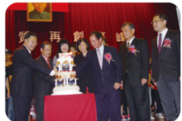
▲在感恩的心、生日快樂歌聲中與會貴賓切蛋糕祝嶺東生日快樂。