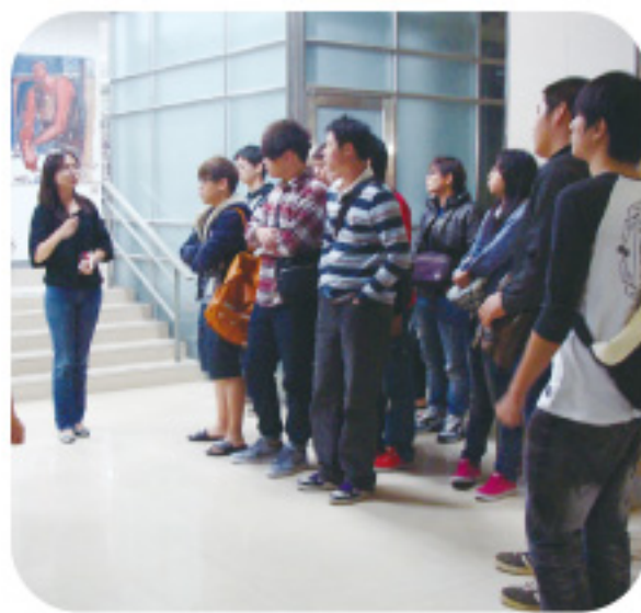
▲ 圖書館館員進行實地導覽。

感謝各位老師及同學的參與，透過新生導覽活動，讓新生於入學之際即能有效掌握圖書館各項資源與服務，及早適應嶺東校園的學習與生活。未來圖書館將更配合學生的需求，使導覽活動內容愈加豐富及生動，藉此拉近與新生的距離，有效達成圖書館推廣利用教育的目標。