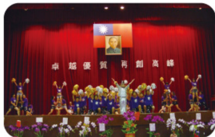
▲2012啦啦冠軍隊行銷與流通管理系舞力全開熱情演出。