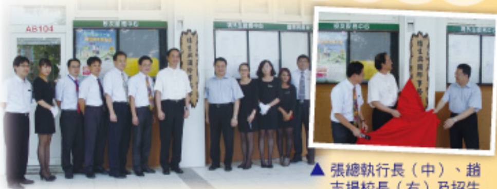
▲「招生與國際事務部」揭牌儀式後與會者合影留念。