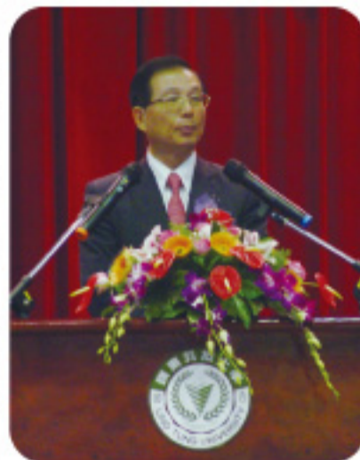
▲嶺東校慶吳前部長清基親臨祝嶺東生日快樂。

歡慶本校48週年校慶之際，校長趙志揚博士亦期許所有師生及早做好準備，以因應全球化及國內各種競爭的挑戰！