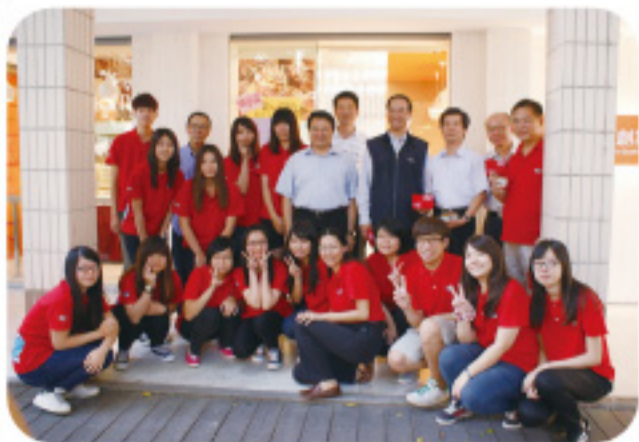
▲趙校長及與會主管來賓於創業教室前與烘焙社社員合影留念。

未來，系上將開設相關課程來搭配此專業教室的使用，在全系教職員工的努力下，共同來實現大家對「觀心烘焙坊-Cheers Bakery」的期待。