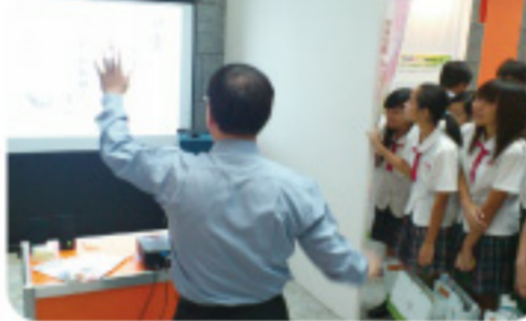
▲ 創新創意展展出作品吸引大批群眾圍觀。