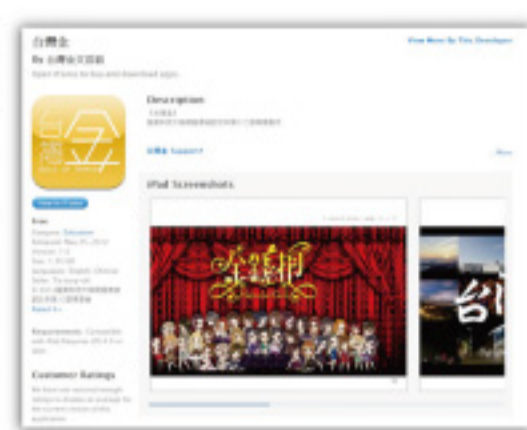
▲全世界第一本設計系所作品「雲端」問世一視傳系「台灣金」閃亮上架!

此次視傳系畢業作品以互動電子書的形式出版，不但可以說是全世界的創舉，更是台灣第一；不僅反應出視傳系的課程規畫與人才培育的方向與當前設計產業的脈動與國家重點發展規劃呼應，更希望在設計教育與產業需求上扮演先驅與媒合的角色。