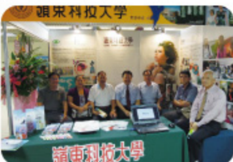
▲ 開幕當天亦有不少南區校友們進館來關心母校,相互分享近況,人潮絡繹不絕。