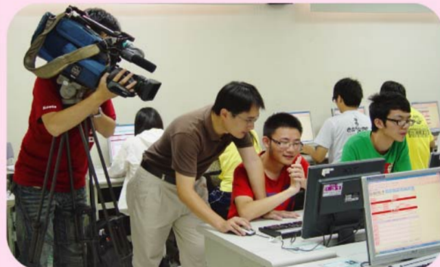
▲公共電視台於9月13日特別蒞校採訪校長趙志揚博士有關招收大陸學位生的議題，並且拍攝大陸學位生課堂的學習情形。

在9月中秋假期的日月潭之旅後，學校也將針對所有陸生（含學位生及短期交流生）安排一場迎新活動，歡迎他們加入嶺東大家庭的行列，並能順利圓滿取得台灣的學位。