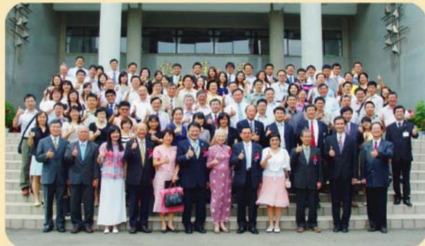
▲本校第16任校長交接典禮會後，與會貴賓於亞萍館前合影留念。

教授以上師資已躍升到82%，第二校區的知源教學大樓與寶文教學大樓也已先後完工進駐，100年本校獲得教育部通過100至101年度技職校院獎勵大學教學卓越計畫。