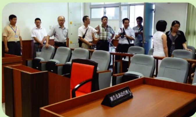
▲本校財經法律研究所接待來自湖州職業技術學院貴賓，參觀財法所實習法庭。

本校財經法律研究所100學年度除依往例進行中小學法治教育、發行嶺東財經法學期刊、擔任企業法律顧問及法律專業課程全