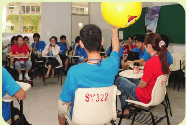
▲新生們認真地參與團體活動。

資源教室謹代表身心障礙學生感謝長官和師長們的用心與關懷，相信學校傳遞的友善氛圍、師長們溫暖的愛，是令學生安心學習與自信成長的堅強後盾！