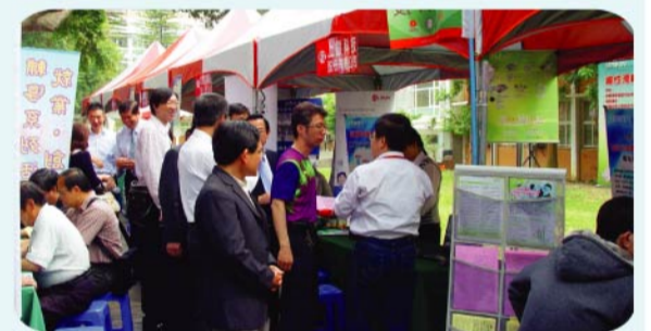
▲徵才博覽會會場一隅。

廠商簽完名字就可參加摸彩，活動獎項都是由本次參與廠商共同響應提供，其中嶺東科技大學校友會總會也提供NB一台進行抽獎，大會活動在精彩的抽獎活動下圓滿落幕，也為「嶺東金鷹 職場飛揚 Ucan Fly 2011中部地區產業群聚校園聯合就業徵才博覽會」畫下了完美的句點。