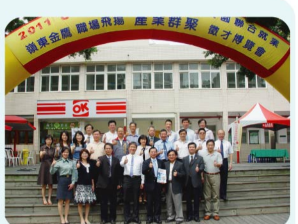
▲本校與行政院勞委會中彰投區就業服務中心以及中區職業訓練中心，共同舉辦「嶺東金鷹職場飛揚 Ucan Fly」2011中部地區產業群聚校園聯合就業徵才博覽會。

本次活動參與人數近千人，媒合率竟高達45%，同時媒合廠商也表示參與眾多的學校就博覽會，這場次的成效是最高的，進一步表示想長期與本校搭配實習及產學合作案，以便更有效的完成人才培育計畫。另外，為了讓學生可以清楚了解職場，特辦理職場知多少的摸彩抽獎活動，當天應屆畢業生只要讓15家參與