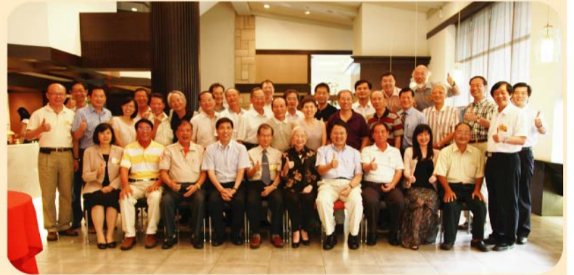
▲南區校友會舉辦中秋聯誼活動，歡迎母校師長的到訪。

席間大家紛紛細說當年在母校的有趣回憶：第一、二屆的學長，協助將校舍的一磚一瓦蓋起來，便當裡總