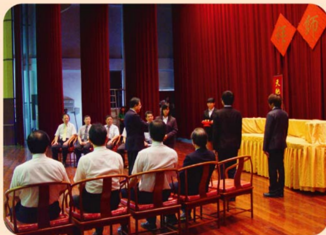
▲本校於每年開學典禮時遵循古禮舉辦拜師禮，讓新生感受師道之重要。

【本刊訊】本校100學年度日間部各學制新生開學典禮於9月5日舉行，今年援例以拜師禮儀迎接新生入學，現場氣氛讓人感覺既新奇又莊嚴。