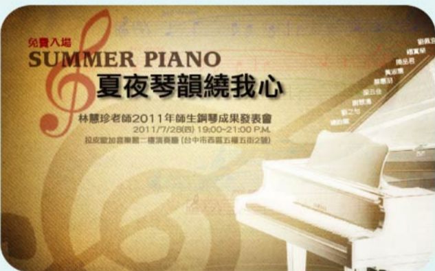
▲本次音樂會精美電子邀卡。