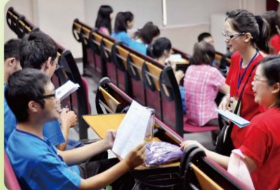
▲夏令營新生與導師的學長姐相處和樂。