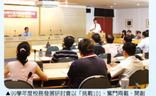
▲99學年度校務發展研討會以「挑戰101、奮鬥兩載、開創新局」為題...