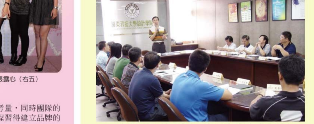
▲人事室於聖樓三樓設計學院會議室舉辦新進教職職員職前座談會。