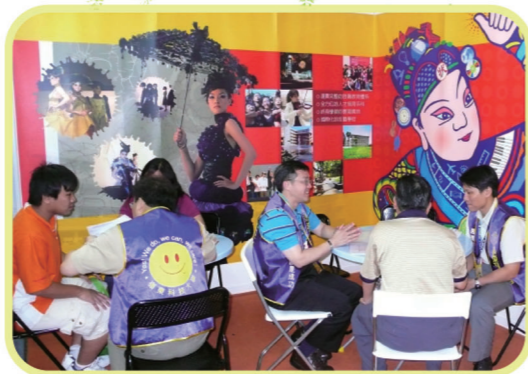
▲本校以獨特的設計風格在教育展上「技職群像」，吸引了許多家長、學生、甚至其他參展學校師長的目光，紛紛前來詢問就讀的可能性，成效頗佳。