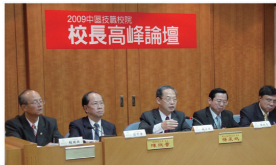
▲「2009中區技職校院校長高峰論壇」於本校亞萍館國際會議廳中廳舉行。

在臺灣高等院校學生短缺日益嚴重的情況下，陸生來臺就學與採認大陸學歷等議題備受各界關注，中區技職校院各校校長的經驗與建議，或可提供教育機關一些妥適的參考方向。