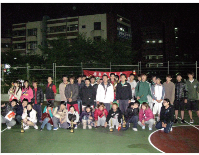
▲進修部學生會舉辦三對三籃球比賽，圓滿成功。