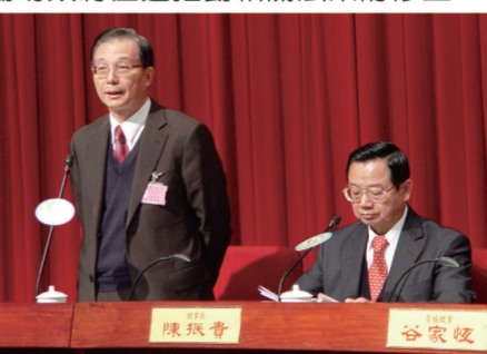
▲教育部吳清基部長(左)蒞會指導，並進行「教育施政理念與政策」專題演講，右為本校校長同時也是私立技專校院協進會理事長陳振貴博士。