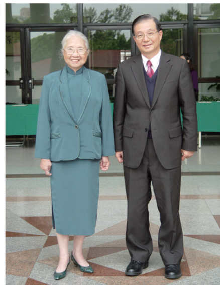
▲教育部吳清基部長(右)與本校創辦人黎明博士於亞萍館前合影。

會後吳部長並參觀本校校園設施與教學成果，包括設計學院、財經學院及錢幣博物館，且與學校外籍生、大陸交換生有良好的互動，對於本校在推動技職教育的努力與成就，給予高度的肯定。