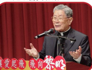
▲天主教單國璽樞機主教親臨會場演講，為生命教育帶來最真實的現身說法。