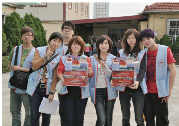
▲「嶺東博愛社」希望藉由「傳愛送暖580」的活動，能幫助史瓦濟蘭的愛滋遺孤度過一個充滿希望與溫暖的寒冬。

嶺東博愛社將於3月17日至4月30日在校內木棧道、聖益樓1F設置愛心站，方便師長、同學們參與認捐與瞭解相關訊息，社員們也會在各系、各班、各行政單位廣為宣導和募款，希望大家能一同參與這場愛心盛會！