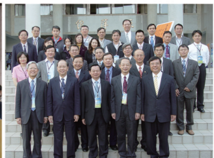
▲「2009中區技職校院校長高峰論壇」與會者於亞萍館前合影。