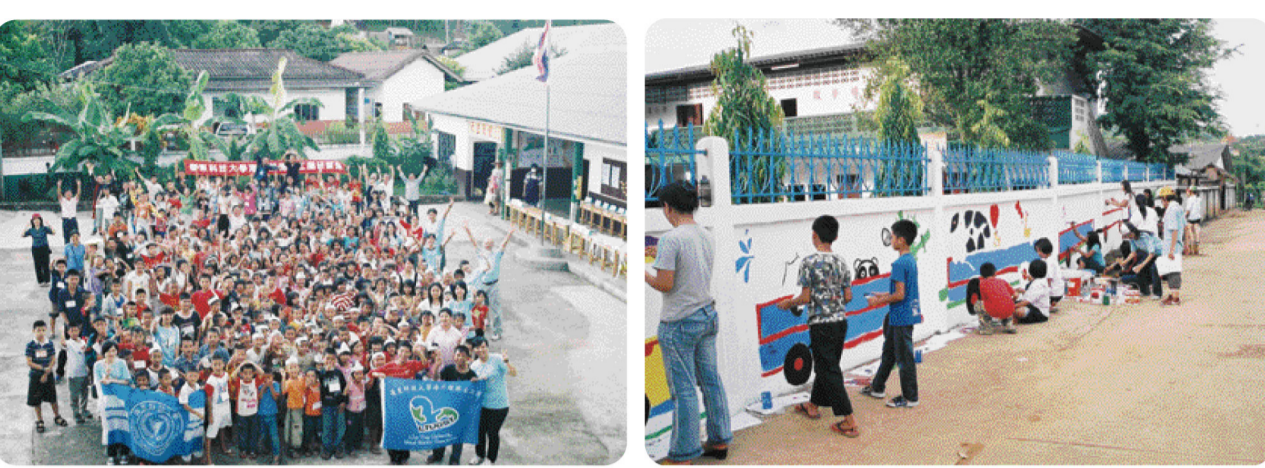
▲本校的16名師生，於7月31日再度帶著台灣的愛與關懷，到泰北進行為期15天的教育志工服務。

在教育部極力呼籲提倡品德運動的今天，這一群參與海外志工的年輕學子，正在用行动落實品德教育的具體價值，把關愛的情懷從本土推向世界另一個角落，體驗人性「善」的真諦。