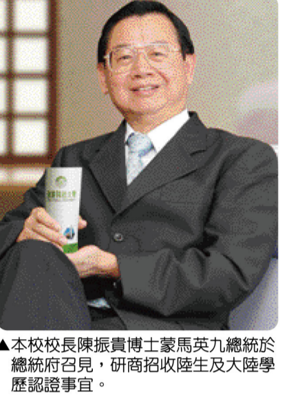
▲本校校長陳振貴博士蒙馬英九總統於總統府召見，研商招收陸生及大陸學歷認證事宜。

最後馬總統指示以「三限六不」政策，即限制探認高等學校、限制來臺陸生總量、限制學歷探認領域、不涉及加分優待、不影響國內招生名額、不編列獎助學金、不允許校外打工、不含有在臺就業問題及不得報考公職考試等配套措施，漸進開放，審慎評估，採穩健務打的方式招收陸生，並責成教育部及總統府相關單位繼續研商辦理相關事宜。