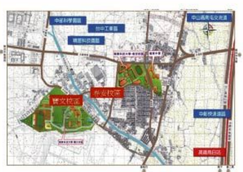
▲本校附近的產業聚落漸次形成，有效激勵師生們的創新研發能量。