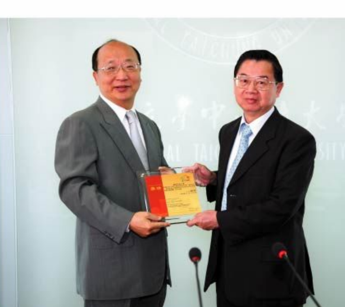
▲本校榮獲「台中市97年度大專院校垃圾分類、資源回收、源頭減量及推廣資源回收再製品(料)考評競賽特優獎」獎狀，由校長陳振貴(左)代表本校接受台中市長胡志強頒獎表揚。