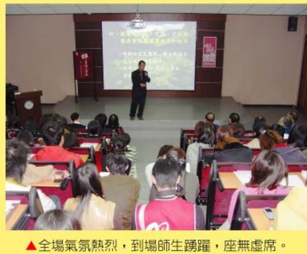
▲全場氣氛熱烈，到場師生踴躍，座無虛席。