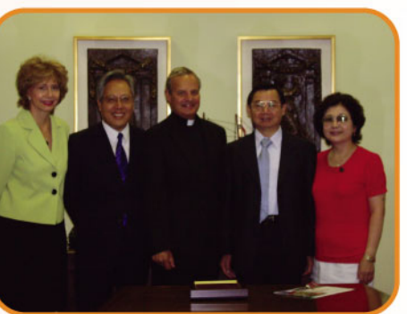
▲本校訪問團至巴西聖保羅大學(Universidad de Sao Paulo, Brazil)參訪。