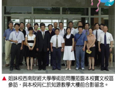
▲姐妹校西南財經大學學術訪問團蒞臨本校交收震災捐款儀式，與本校同仁於知識廣場大樓前合影留念。