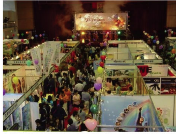
▲國科會產學合作研究計畫正副組長多元發展，本校積極配合研發技術特色。