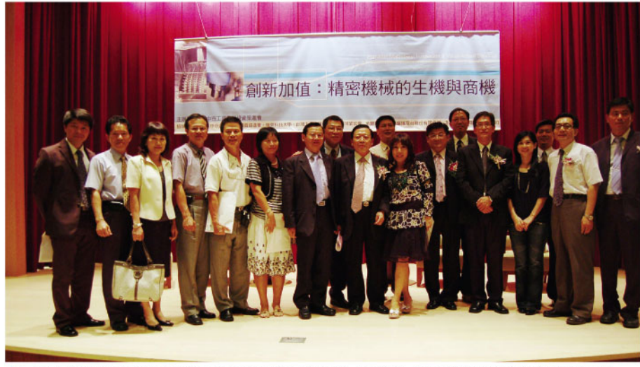
▲三創育成中心舉辦「創新加值：精密機械的生機與商機」研討會，提供精密機械科技園區產學合作的新契機。