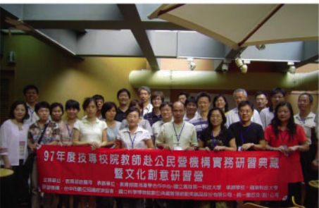
▲「典藏暨文化創意研習營」全體學員於閉幕後合影。