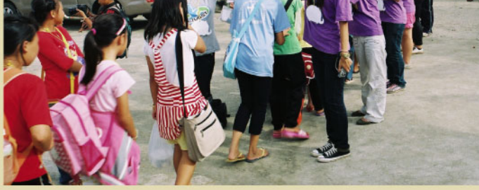
▲本校海外志工團於結業式後起唱手歌送北滿星疊回龍小學學生放學。