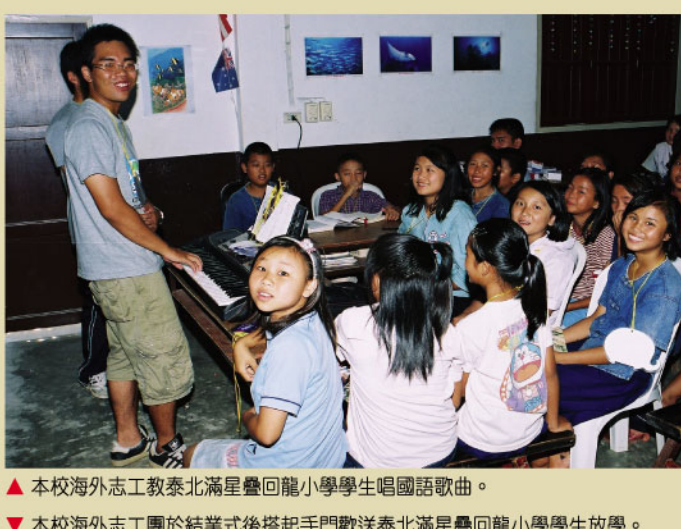
▲本校海外志工服務隊北滿星疊回龍小學學生唱國語歌曲。