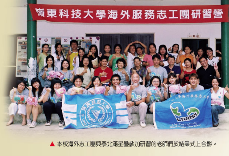
▲本校海外志工團與北滿星疊疊加研習的老師們於結業式上合影。