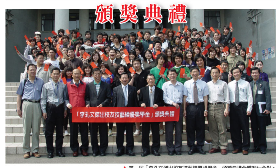
▲第一屆「李孔文傑出校友技藝績優獎學金」頒獎典禮全體師生合影。