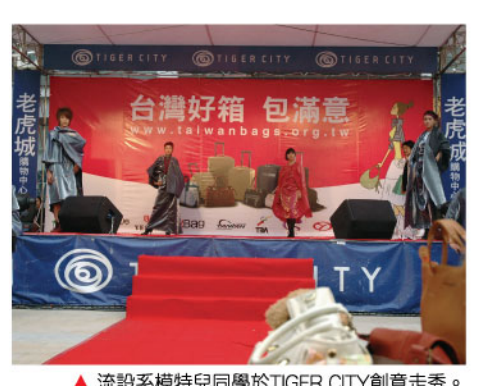
▲流設系模特兒同學於TIGER CITY創意秀走秀。