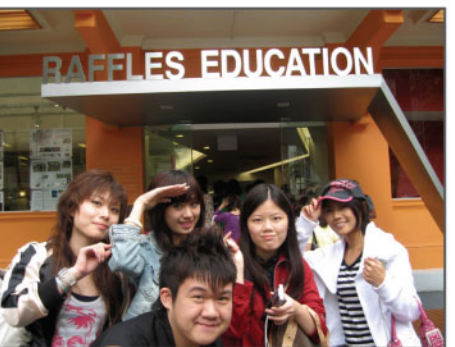
▲同學們在萊佛士設計學院的留影。