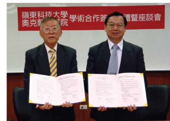
▲本校與紐西蘭奧克蘭商學院簽署學術合作協議書。