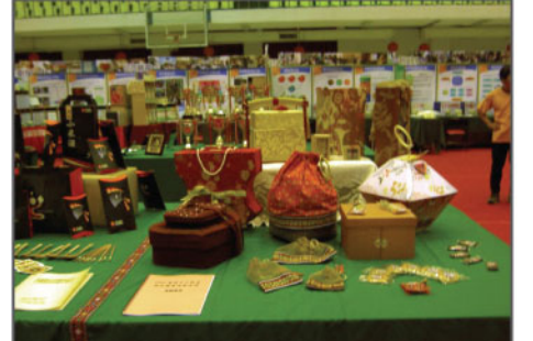
▲本校產學合作成果表現亮麗。