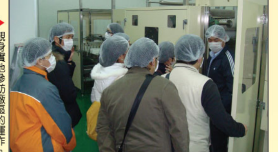
▲親臨現場參訪廠區的運作。