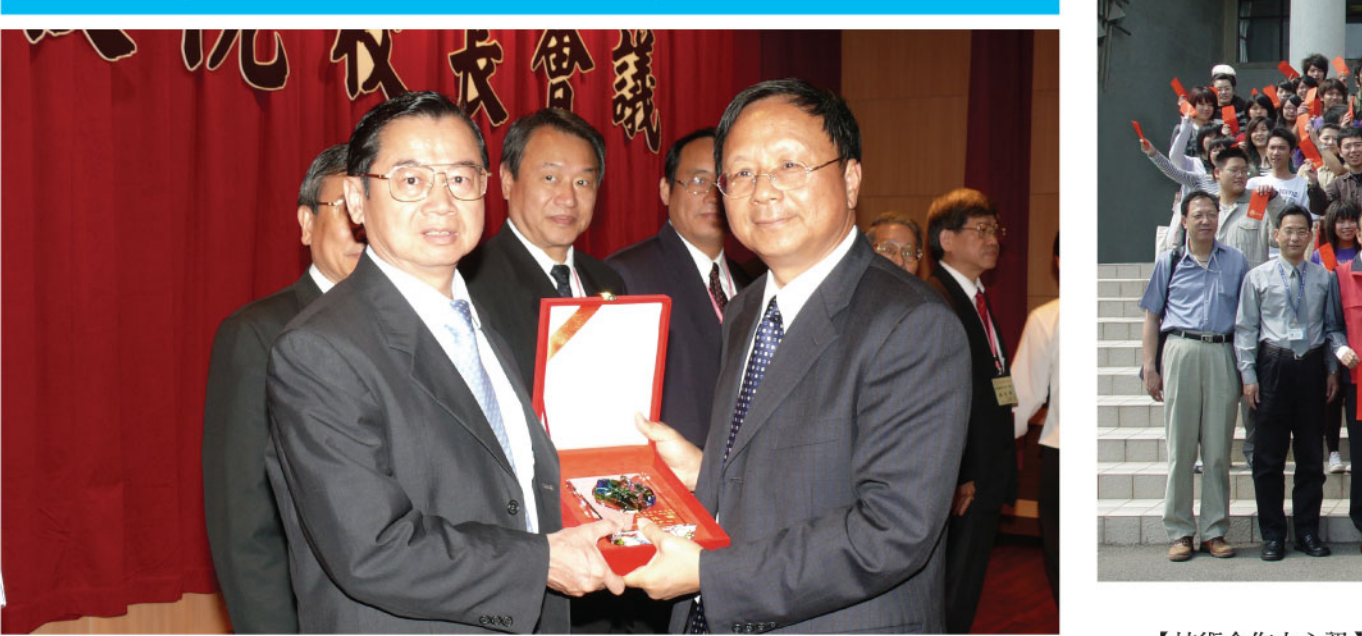
▲本校榮獲教育部部長親自頒贈「功在技職」獎牌之際，由陳校長(左)代表領獎。