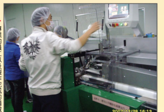
▲應邀講解人員詳細解說廠區的運作。