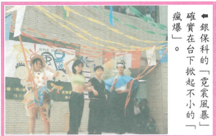
銀保科的「愛賞風暴」確實在校下掀起不小的「風暴」。

記者/何書慧 何謂「遠距教學」？相信同學們必定很陌生吧！但別小看這新名詞喔！這可是和咱們專科生有著密切的關係呢！ 根據教務處吳志揚主任表示，「遠距教學」乃是將國立大學當作主播教室，私立大學與專科當作遙端教室，把國立大學開設的課程藉由遠距教學輸出到私立大專院校，供私立學生選修，即類似空中大學的教學方式。