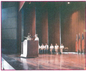
夜間部始業輔導暨董事會對同學多所期勉。

【本刊訊】為幫助同學們解決學業及生活中的困難，讓同學們在課堂之餘有機會向自己信賴的老師請益，學校自本學期起實施專任教師每週至少留校四天的規定。 這項每週留校四天的規定，是於本學年第一學期第三次行政主管會議中所議決，並經由教務處及各科主任於相關會議上宣布，希望能確實執行。 郭校長對學校實施此一規定表示，或許有些老師對此一規定有疑慮或不習慣，其實站在學校的立場，只是單純的希望老師在授課之餘，能撥出一些時間供同學們發問，與同學們溝通；同時也可以關心學校的各項工作。一些關於與瞭解。所以學校在訂定實施辦法時，採取較為彈性的處理，老師們可以選擇八個半天或四個全天向科裡登記，並授權科主任核可。 郭校長說，本校確實有許多未兼行政工作的專任老師頗受學生歡迎，但同學也常反映，要找老師「真的好難」！如果老師留校的時間可以讓同學們的溝通道可以更為暢通些。郭校長並補充說：「專任老師與兼課老師之間，應該有些不同吧！」 這項辦法實施至今已近兩個月的時間，同學們尚不十分清楚這項規定，郭校長希望同學們能養成與老師約時間，向老師請益的好習慣，讓不論在知識與生活經驗方面都有相當豐富的老師能在生活上「傾囊相授」，不僅有益學業，或許可以及時調整偏差的觀念和行為。