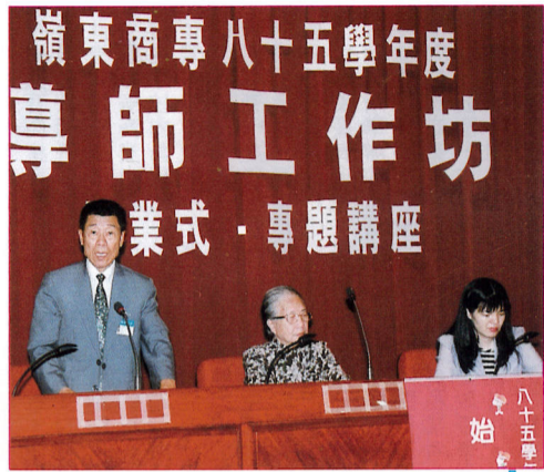
嶺東商專八十五學年度導師工作坊 業式·專題講座

【學輔中心訊】本校承辦教育部訓委會委託之「八十五學年度專科學校導師輔導專題研習營」於八月廿一日起至廿三日舉行，參加成員為來自全國各專科學校的導師。 此次承辦單位特別選在國內第一個結合遊樂區的文化休閒度假旅館「台灣民俗文化村」——月山莊進行研習活動，並禮聘台灣師大林幸台教授、成大饒夢霞教授及中台醫專魏清堂教授擔任專題講座；同時邀請企業界傑出人士，包括「捷盟公司」黃惠煥總經理、「中國生產