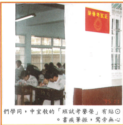
同學們，中室教的「班試考譽榮」有貼 。書疾筆振，驚旁無心

夠充滿榮譽的心去面對每次的考試，而沒有不好的行為出現。常言道：「靠山山倒，靠人人倒，靠自己最好。」不管是面臨什麼樣的考試，看到考試題目，會就會，不會就不會，千萬別把得失看得太重，自然也就會做好自己本份的事。另外，常可在校園內，看見副校長及教務主任兩人彎著腰往地上去撿垃圾，為什麼會有這麼多的垃圾呢？難道同學們的公德心都埋沒了，連榮譽感也都隱藏了嗎？校園的乾淨與否，是要全校同學自己去做選擇的。乾淨的校園，讓人們感覺本校同學的勤奮及公德心，也能讓我們充滿榮譽感，因此，不只要有課業上的榮譽感，更要有道德上的榮譽感。希望本校同學都能從本身做起，而延伸到全體，使本校的整體氣質更為提升，使同學們各個都能充滿自信心及榮譽感。 學校有如一個大團體，想要擁有一個充滿榮譽感的校園氣息，是需要靠全校同學們一起去實行的。因此，朋友們，讓我們一同攜手共創一個人人充滿榮譽感的校園，邁向更美好的一天。