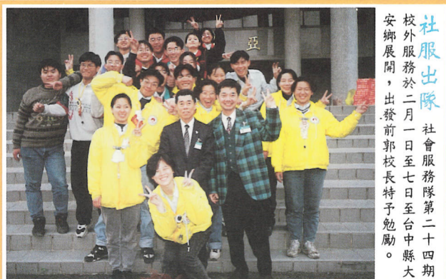
社服出隊 社會服務隊第二十四期校外服務於二月一日至七日在台中縣大安鄉展開，出發前郭校長特予勉勵。

另外國際中心課後語文輔導將於三月十一日開課，此次爲配合夜間部同學課間開星期一至、二、四、五，一星期四次上課時間，下午五點卅分至六點廿分語文輔導。夜間部同學反應熱烈，求知慾不輸於日間部同學，實難能可貴，令人感佩。國學中心除定期辦理寒、暑假海外語文研習團及課後語文輔導外，更加強有意出國進修同學提供留學資訊，有意出國進修或有任何與語文相關問題的同学，歡迎隨時到仰德三樓本中心洽詢。