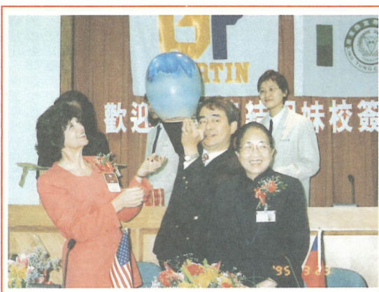
攝鈺翎。長校特麗格瑪與贈器陶以長校黎▲

【本刊訊】本校於三月二十三日與美國田納西大學馬丁分校締結為姊妹學校，今後將進行密切的學術交流，並提供師生互換及學生進修的機會。教育部高教司吳椿榮副司長、邱耀賢科長與技職司江義清視察均到場觀禮。