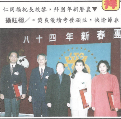
仁同福祝校長黎，拜團年新春團拜 攝鈺翎／。獎良優績考發頒並，快愉節春

謝主任亦期許日後的社會大學能有更充實的有聲資料，並且能拓寬場地限制及增加硬體設備，以服務更多的老師與同學，讓大家有更好的環境取得資料。 學校這座位於亞萍館一樓的有聲圖書室，著實值得各位同學們善加利用。同學們空堂時沒去處？聯誼時好無聊？帶張自己的學生證，社會大學非常歡迎您一同加入充電的行列。