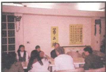
▲參觀觀山文物陳列館