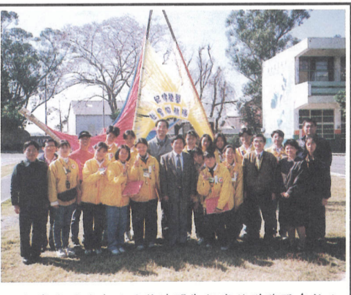
▲社服隊於假期期間赴遠里埔小園二行