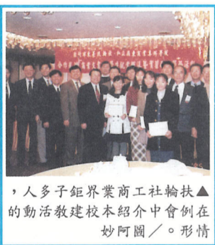
▲扶輪社中區介紹商業界人士到本校活動的合影