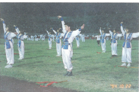
流行舞蹈社在體育館中表演，掌聲就是最大的欣慰。

【本報訊】八十三學年度第一學期夜間部部務會議於三月九日在仙庭樓五樓會議室召開。會中針對夜間部教務、訓導、總務各方面問題提出檢討，並對學生座談會中所提建議加以處理。 對於學生座談會中提建議，部務會議中作成決議，將比照日間部成績單製作，不論學生成績及格與否，均將打在成績單上，以符合教育部規定。有關學生請假審核，則修正如下： 一、二天以上病假得提出任何足資證明就醫之資料（如健保卡、繳費收據、掛號單等）請病假。 二、二天以上病假須附醫師診斷證明。 三、因病不得以家長證明請事假。 四、公司假仍以每月一天為原則，並列表管制，如因公司派遣參加與其業務相關之講習或訓練提出公函證明請事假，但以一週為限。 總務組針對夜間部校車問題加以說明表示，學校的校車純粹是為了服務同學，而非營利，希望同學們明瞭，目前的十部車中，除彰化(21)、南投(23)、草屯(28)、豐原(17)四線人數超過五十人以上，其餘八線均在二十餘人以下，希望同學們珍惜這些可貴的資源。