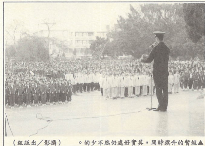
的少不然仍處好實其，間時旗升的暫短▲

【本刊訊】本校企管科於上學期曾舉辦了一次「十大票選」活動，想藉此瞭解本校同學對目前社會上一些與專科的興趣趨向，分別就「男歌手」、「女歌手」、「最佳電影」、「最受歡迎書籍」與「最受歡迎電視」等五項進行票選。依據票選結果，本校同學所認同的「十大」分別是： 一、男歌手：(1)張學友(2)周華健(3)劉德華。 二、女歌手：(1)張清芳(2)林憶蓮(3)陳淑樺。 三、最佳電影：(1)侏羅紀公園(2)今生有約(3)黑色豪門企業。 四、最受歡迎書籍：(1)流行服飾(2)極短篇(3)言情小說 五、最嚮往國家：(1)澳洲(2)法國(3)加拿大。 另外，在不提示票選名單的情形下，得票最高的分別為： 國家：紐西蘭 書籍：漫畫 電影：真愛 女：葉倩文 男：郭富城 女歌手：張清芳 男歌手：劉德華 這項票選活動也許未必能完全顯示本校同學的喜好，但是多少可以由其中窺知一些流行訊息，同時也為校園中，添加了一些熱絡的氣氛。