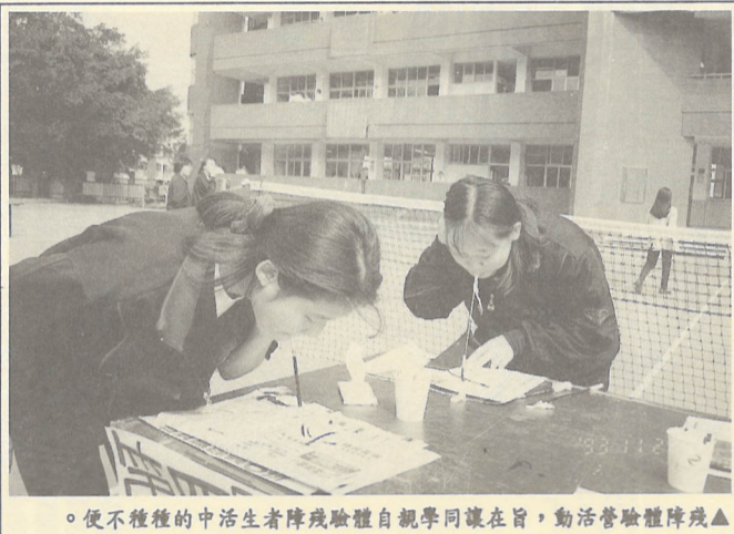
▲殘障體驗營活動，同學親自體驗殘障者生活的不便。

社服隊榮獲全國大專績優社團優等獎 社會服務隊代表學校參加八十二學年度全國大專院校績優社團評鑑，榮獲優等獎。 此次評鑑分為專科組及大學組，本校社會服務隊於獲獎後，於十月卅日在台北劍潭海外青年活動中心接受頒獎，於十一月二十二日利用週會時間歡慶，將此項榮譽與全校師生共享。