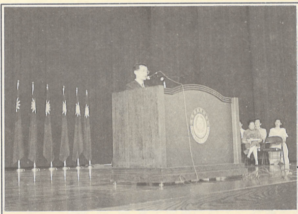
▲徐中雄立委蒞校演講，談如何與殘障人士相處。徐博士表示，雖然社會風氣隨著時代的轉變日益開放，但是大體上說來，整個社會環境還是無法全然接受殘障人士。

【本刊訊】為關懷殘障同胞，配合本校一系列的年度關懷殘障活動，協助本校殘障同學學習如何安頓自我的生活，並引導一般人建立與殘障者相處的正確觀念。本校於十一月十八日由中心輔中心力邀立委徐中雄博士蒞校演講，以一為題，現身說法，將自己的成長經驗與在場千餘位師生共同分享。徐博士表示：雖然社會風氣隨著時代的轉變日益開放，但是大體上說來，整個社會環境還是無法全然接受殘障人士。其實殘障者與一般人不同的地方多於與一般人不同的地方，而平時大眾在