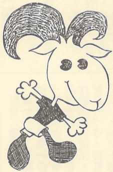
「吉祥阿寶」將成為本校的象徵

不祭俯首神傷。張副校長也回憶起當年初至嶺東時的簡陋，如今為了擴增校地，隨同校長上山涉水，走遍台灣南北各地，才更深刻體會到當年創校尋覓校地的艱難。目前依照委員會的討論，建校卅週年將設計一系列的活動做全年的推廣，目的在於希望師生共同參與分享建校卅週年的喜悅與成果。在一系列的活動中，最值得一提的是本校將在卅週年校慶來臨的這一年，推出一種足以象徵本校師生精神的「吉祥物」，日後並將以此「吉祥物」做為本校的代表圖案。此一決定，不僅將成為國內大專院校的創舉，如果付諸實現，也將是一件極富意義的工作。