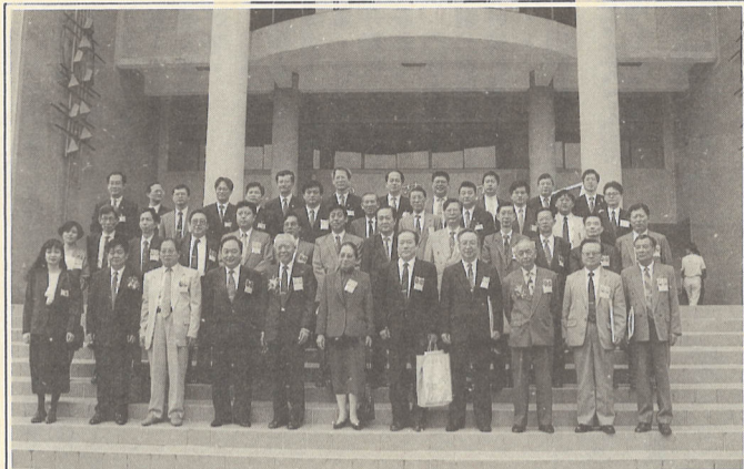
▲大陸學者此行來訪最大意義在於促進海峽兩岸高等學術交流。

【本刊訊】以促進海峽兩岸高等教育學術交流為目的所舉辦的「二十一世紀海峽兩岸學術研討會」，十一月九日於本校舉行，共廿五位大陸高等教育學者蒞校參觀，並以「海峽兩岸終身教育現況與展望」